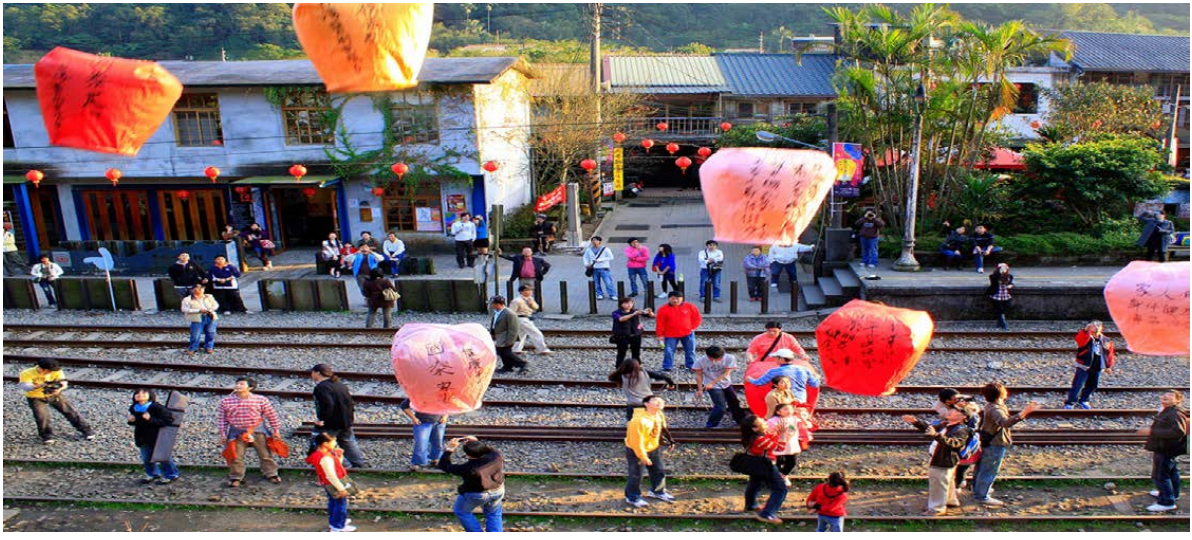
SHSLTPE5 ทัวร์ไต้หวัน สุริยันจันทรา ไถจง จิวเฟิ่น 5 วัน 4 คืน เม.ย. 67 SL (240167)

นำท่านเดินทางสู่ ถนนโบราณสี่เฟิ่น (Shifen Old Street) เป็นชุมชนเล็กๆ ริมหางรถไฟสายเก่าของสาย รถไฟฝิงซี (Ping xi Line) ถนนแห่งนี้เป็นชุมชนเก่าแก่ที่เมื่อก่อนเป็นเส้นทางลำเลียงถ่านหินสมัยที่ญี่ปุ่นยึด ครองไต้หวัน นักท่องเที่ยวนิยมมาปล่อยโคมลอยกระดาษ เมื่อซื้อโคมไฟก็มีการเขียนความปรารถนาที่จะ อธิษฐานและปล่อยขึ้นท้องฟ้า และสนุกกับการเดินเล่นไปตามรางรถไฟ มีร้านอาหารและไปสการ์ดให้เลือกซื้อ ร้านขายงานฝีมือผลิตภัณฑ์โคมไฟ (ฟรี!!! ค่าโคม 1 โคม/ 4 คน