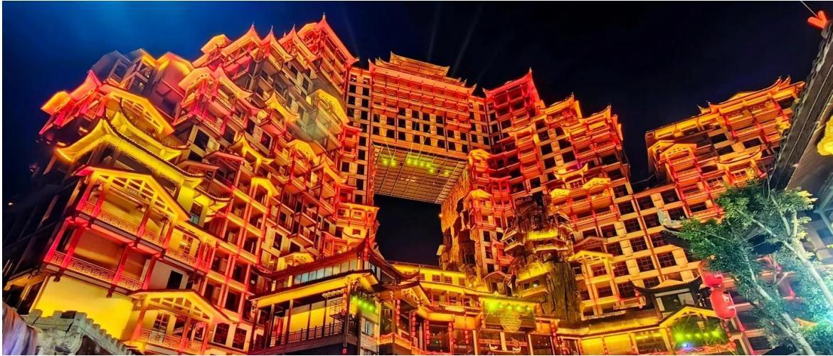
ที่พัก REZEN S HEYI HOTEL หรือเทียบเท่าระดับ 5 ดาว (มาตรฐานประเทศจีน)

วันที่สาม เขาเทียนเหมินซาน (รวมกระเช้าขึ้นลง)- ระเบิดงแก้ว – บันไดเลื่อน 999 ชั้น – ถ้ำประตูสวรรค์ – เมืองโบราณฝูหรง - น้ำตกฝูหรง - จีโส่ว