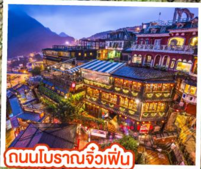
ถนนโบราณจิวเฟิ่น