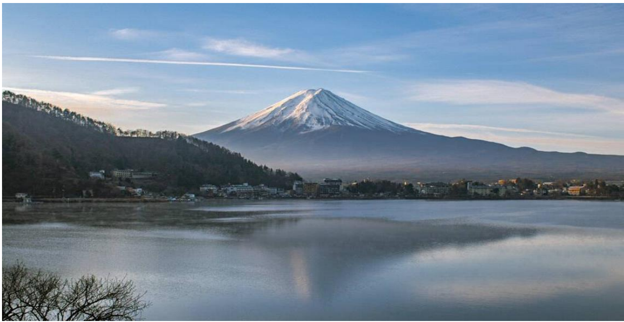
GO2HND-TG013- JAPAN ALPS WALL TAKAYAMA OSAKA 7D 5N BY TG

นำท่านขึ้น ภูเขาไฟฟูจิ (Mt.Fuji) ที่ตั้งตระหง่านอยู่เหนือเกาะญี่ปุ่นด้วยความสูง 3,776 เมตรจากระดับน้ำทะเล นำท่านชื่นชมความงามกันแบบใกล้ชิดยังบริเวณ “ชั้น 5” ของภูเขาไฟฟูจิ (ชั้นอยู่กับสภาพภูมิอากาศ) ให้ท่านได้สัมผัสอากาศอันบริสุทธิ์บนยอดเขาฟูจิ ถ่ายภาพที่ระลึกกับภูเขาไฟที่ได้ชื่อว่ามีสัดส่วนสวยงามที่สุดในโลก ซึ่งเป็นภูเขาไฟที่ยังดับไม่สนิท และมีความสูงที่สุดในประเทศญี่ปุ่น หมายเหตุ: ในกรณีที่ ภูเขาไฟฟูจิไม่สามารถขึ้นได้เนื่องจากสภาพอากาศ ทางบริษัทฯ ขอสงวนสิทธิ์เปลี่ยนโปรแกรมทัวร์เป็น Fuji Visitor Center ซึ่งท่านสามารถศึกษาความเป็นมาของภูเขาไฟฟูจิและเลือกซื้อของที่ระลึกเกี่ยวกับภูเขาไฟฟูจิได้ และยังเป็นจุดถ่ายรูปกับภูเขาไฟฟูจิที่สวยงามในช่วงฤดูหนาว