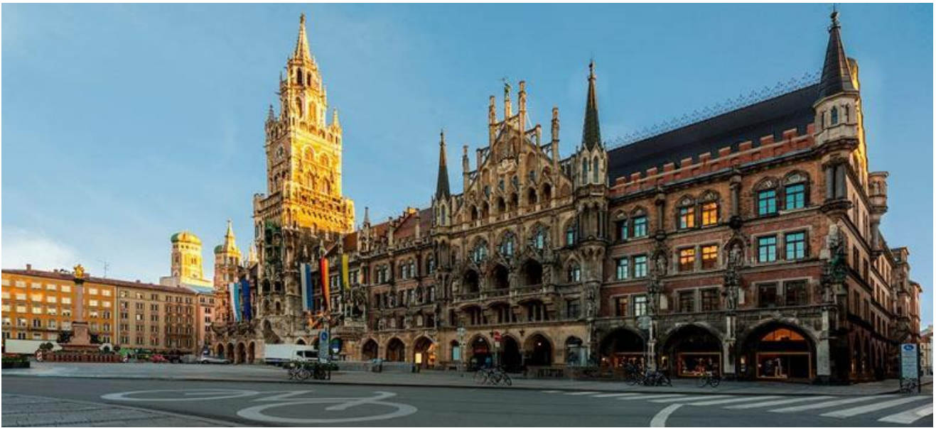
พอเรสอันขึ้นชื่อ ณ เมืองต้นตำรับตามอัธยาศัย และเพลิดเพลินกับการเลือกซื้อสินค้าที่ระลึก

รูปแบบสถาปัตยกรรมแบบโกธิคที่งดงามซึ่งสร้างขึ้นในช่วงปลายคริสต์ศตวรรษที่ 19 ใช้เวลาสร้างถึง 42 ปี มีหอรระฆังสูง 85 เมตร ซึ่งจะมีนักท่องเที่ยวรอคอยเฝ้าชมตุ๊กตาไขลานที่จะออกมาเต้นรำ เมื่อนาฬิกาตีบอกเวลา 11.00 น. และ 17.00 น. อิสระท่านเลือกซื้อสินค้าแบรนด์เนม และของฝากตามอัธยาศัย