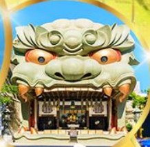
ศาลเจ้า นัมบะ ยาชากะ