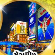
ช้อปปิ้ง ชินโซบาชิ