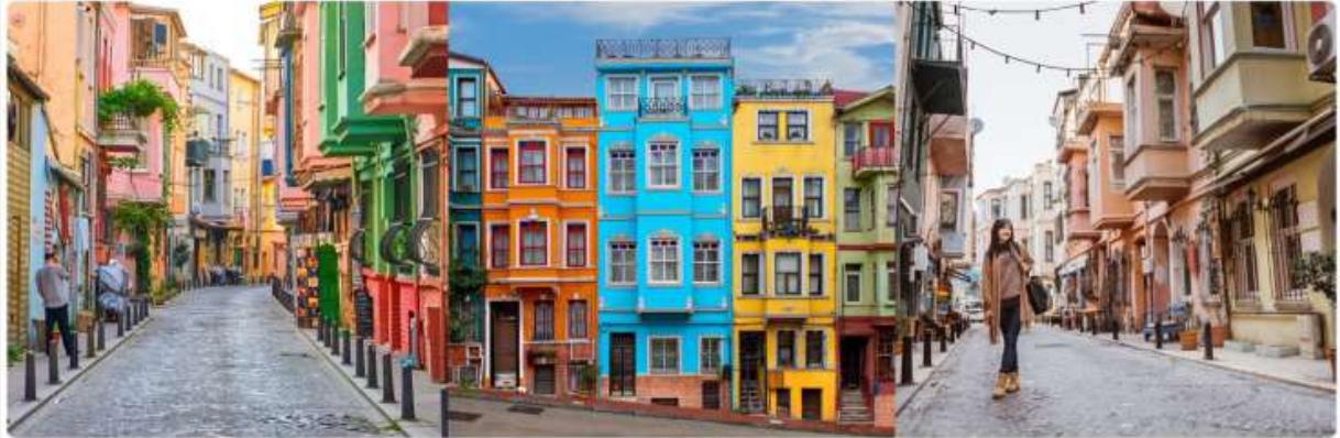
คำ อิสระอาหารค่ำ เพื่อความสะดวก ➡ นำท่านเข้าสู่ที่พัก MAYI HOTEL @ISTANBUL หรือเทียบเท่า

แปลกใจเป็นอย่างมาก เนื่องจากความสงบเงียบ และเป็นมิตรของผู้คนในย่านนี้ ทำให้ท่านแทบไม่เชื่อเลยว่ากำลังเดิน เที่ยวอยู่ ณ เมืองอิสตันบูล จนชุมชนนี้ได้ถูกขนานนามจากนักท่องเที่ยวที่มาเยือนว่า ซิงเกวเตเล่ แห่งตุรกี