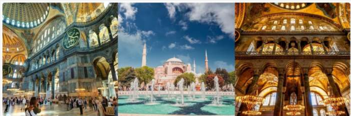
หน้า 13 (ภาพใช้เพื่อการโฆษณาเท่านั้น)

จากนั้นนำทุกท่านแวะถ่ายรูปบริเวณโดยรอบด้านหน้า สุเหร่าเซนต์โซเฟีย (SAINT SOPHIA) หรือ โบสถ์ฮาเจีย โซเฟีย 1 ใน 7 สิ่งมหัศจรรย์ของโลกยุคกลาง ปัจจุบันเป็นที่ประชุมสวดมนต์ของชาวมุสลิม ในอดีตเป็นโบสถ์ทางศาสนาคริสต์พระเจ้าจักรพรรดิคอนสแตนติน เป็นผู้สร้างเมื่อประมาณคริสต์ศตวรรษที่ 13 ใช้เวลาสร้าง 17 ปี เพื่อเป็นโบสถ์ของศาสนาคริสต์แต่ถูกผู้ก่อการร้ายบุกทำลายเผาเสียหลายครั้งเพราะเกิดการขัดแย้งระหว่างพวกที่นับถือศาสนาคริสต์กับศาสนาอิสลามจวบจนถึงรัชสมัยของ พระเจ้าจัสตินเนียนมีอำนาจเหนือตุรกีจึงได้สร้าง โบสถ์เซนต์โซเฟีย ขึ้นใหม่ ใช้เวลาสร้างฐานโบสถ์ 20 ปี ตัวโบสถ์ 5 ปี เมื่อประมาณปี พ.ศ. 1996 (ค.ศ 1435) พระองค์ต้องการให้เป็นสิ่งสวยงามที่สุดได้พยายามหา สิ่งของมีค่าต่างๆมาประดับไว้มากมาย สร้างเสร็จได้มีการเฉลิมฉลองกันอย่างมโหฬารต่อมาเกิดแผ่นดินไหวอย่างใหญ่ทำให้แตกร้างต้องให้ช่างซ่อมจนเรียบริ้อยในสภาพเดิมเมื่อสิ้นสมัยของจักรพรรดิจัสตินเนียน ถึงสมัย พระเจ้าโมฮัมเหม็ดที่ 2 มีอำนาจเหนือตุรกี และเป็นผู้นับถือศาสนาอิสลามจึงได้ดัดแปลงโบสถ์หลังนี้ให้เป็นสุเหร่าของชาวมุสลิม