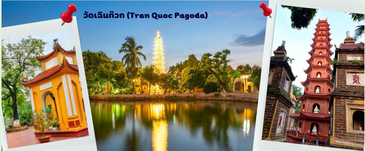
วัดเจินก๊วก (Tran Quoc Pagoda)

จากนั้นนำท่านไป วัดเจินก๊วก (Tran Quoc Pagoda) เป็นวัดที่อยู่ใจกลางเมืองของเวียดนาม ใกล้ชิดกับทะเลสาบตะวันตกของเมืองซานอย สร้างด้วยสถาปัตยกรรมจีนโบราณ มีความร่มรื่น และบรรยากาศดี จึงเป็นที่นิยมของนักท่องเที่ยวทั้งที่ชื่นชอบความงามและมีศรัทธาในพระพุทธศาสนา จากภาพมุมสูงของสถานที่ตั้ง ที่นี้เหมือนตั้งอยู่บนเกาะที่ยื่นลงไปทะเลสาบ แต่มีเส้นทางคมนาคมเข้าถึงที่ สิ่งปลูกสร้างมีการวางผังเป็นอย่างดี ใช้สีสันทึกลมกลืนในโทนสีเหลือง น้ำตาล ตัดกับสีเขียวของต้นไม้ใหญ่ที่โอบล้อมอยู่ ในมุมถ่ายภาพจากอีกฝั่งหนึ่ง จะเห็นสิ่งปลูกสร้างสไตล์จีน และเจดีย์หลายชั้นโดดเด่น มีภาพที่สะท้อนลงสู่ผืนน้ำ เป็นภูมิทัศน์ที่งดงามทั้งยามกลางวันและยามค่ำคืนที่มีการเปิดไฟส่องสว่าง