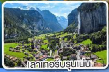
เลาเทอ์บรุนเนน