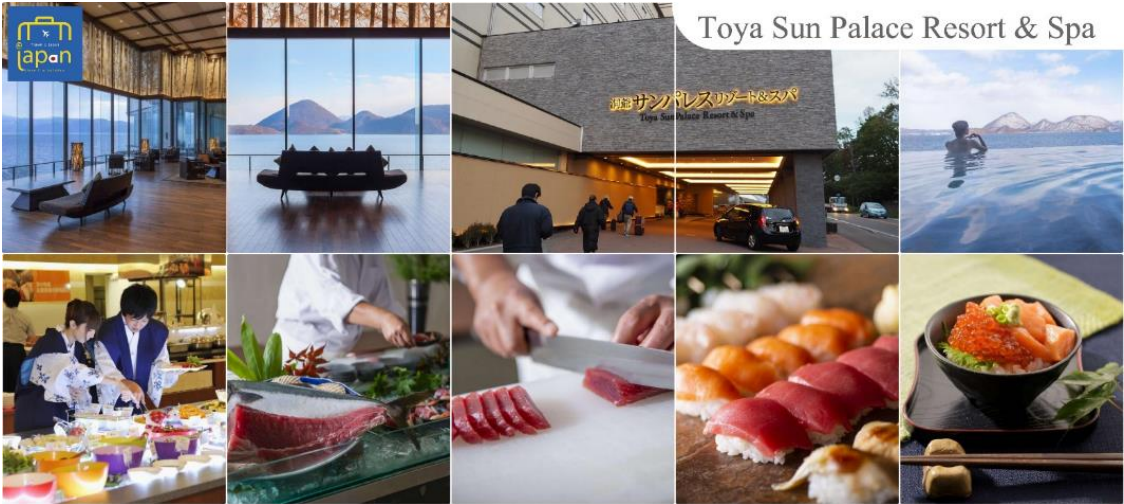
Toya Sun Palace Resort & Spa

ที่พัก TOYA SUN PALACE RESORT & SPA หรือเทียบเท่าระดับเดียวกัน