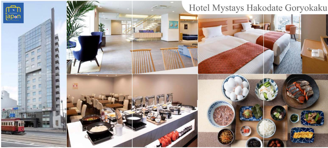
Hotel Mystays Hakodate Goryokaku

ที่พัก HOTEL MYSTAYS HAKODATE GORYOKAKU, HAKODATE หรือเทียบเท่าระดับเดียวกัน