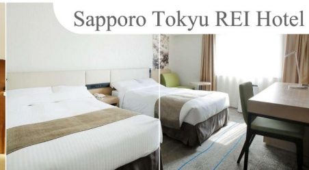
Sapporo Tokyu Rei Hotel