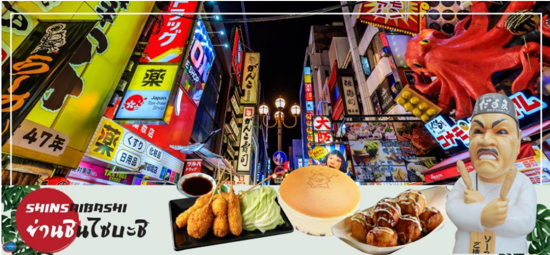
เย็น รับประทานอาหารเย็นอิสระตามอัธยาศัย