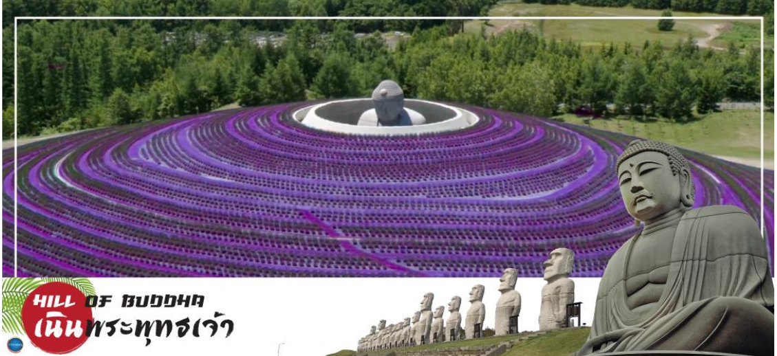
HILL OF ฆบ๓๓๓๓๓ เนินพระพุทธรเจ้า

วันที่เจ็ด ตลาดปลานิโจ – เนินพระพุทธรเจ้า – มิดซุยเอาเล็ดท์ – ทำอากาศยานนิวซีโตเสะ สอกไกโด – ทำอากาศยานนานาชาติคันไซ โอซาก้า