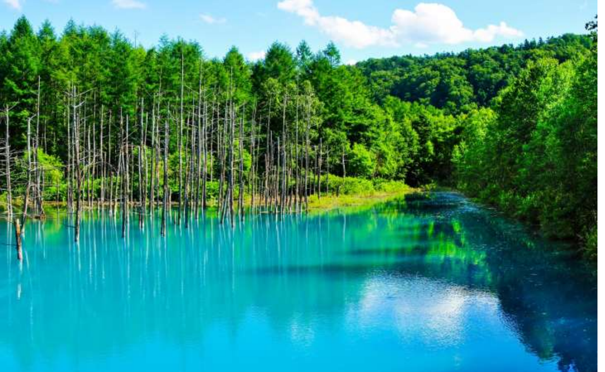
GO2CTS-TG015 -- HOKKAIDO FURANO FRUIT & FLOWER 6D 4N BY TG

เดินทางสู่ เมืองฟูราโน่ (Furano) ตั้งอยู่บริเวณศูนย์กลางของเกาะฮอกไกโด ได้รับฉายาว่า “เฮะ โชะ โนะ มะ ชิ” หรือ “เมืองสะดือ” เทียบชม โทมิตะฟาร์ม (Farm Tomita) ที่มีดอกไม้หลากสายพันธุ์ให้ชม (ขึ้นอยู่กับสภาพอากาศ) แต่ที่มีชื่อเสียงมากก็คงจะเป็นดอกลาเวนเดอร์ นอกจากดอกลาเวนเดอร์จะมีความสวยงามแล้ว ยังได้นำดอกไปสกัดเป็นน้ำหอมและได้รับความนิยมมายาวนานถึง 33 ปี ฟาร์มแห่งนี้ทุกปีจะมีนักท่องเที่ยวมาเที่ยวชมความงามดอกลาเวนเดอร์จำ นวนมาก ส่วนใหญ่มักจะมาในช่วงที่ดอกไม้กำลังเบ่งบาน นั่นก็คือ ในช่วงประมาณเดือน เมษายนถึงเดือนตุลาคม โดยเดือนมิถุนายนถึงเดือนกรกฎาคมเป็นช่วงที่ดอกลาเวนเดอร์สวยงามและเบ่งบานมากกว่าเดือนอื่น ๆ