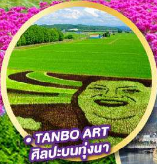
TANBO ART ศิลปะบนทุ่งนา