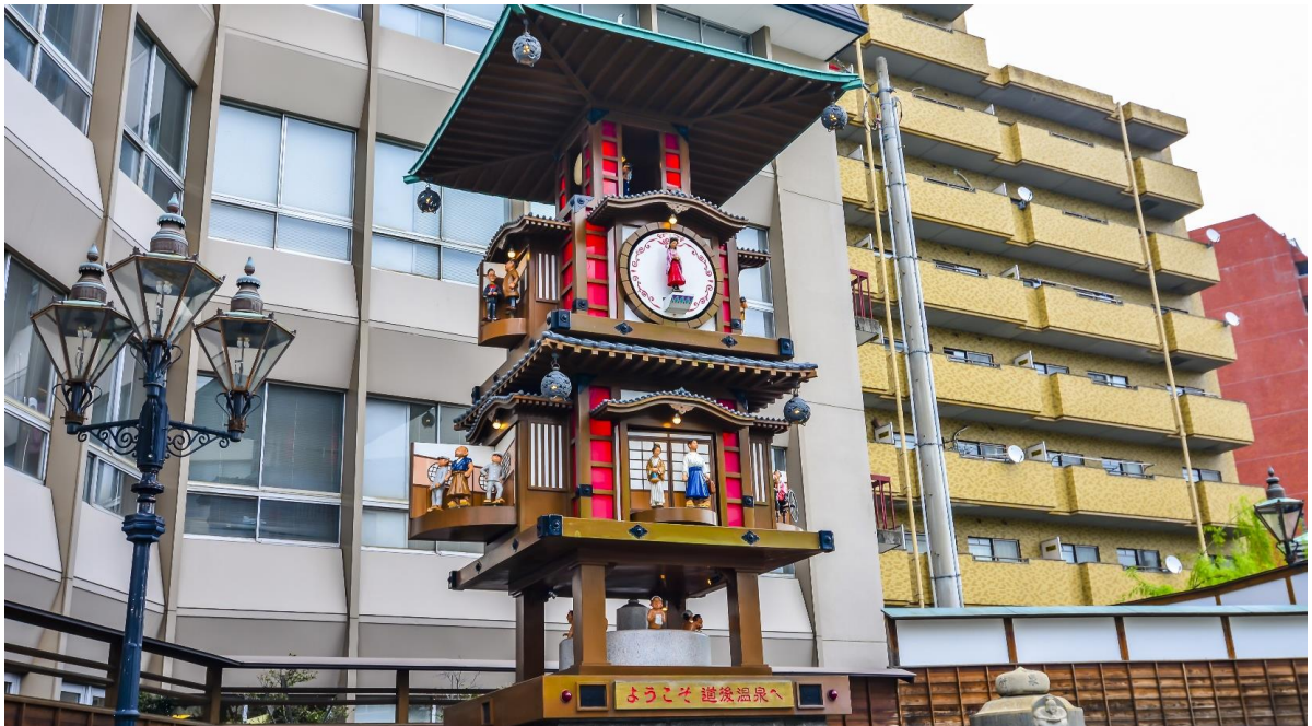
GO2KIX-TG006 -- UNSEEN SHIKOKU ONSEN AUTUMN 6D 4N BY TG

เดินทางสู่ ถนนโดโจะ ไชคาระ มีของฝากท้องถิ่นให้เลือกซื้อมากมาย ซึ่งยาว 250 เมตร และเป็นที่ตั้งของร้านอาหารและร้านค้ากว่า 60 แห่ง มีร้านจำนวนมากที่เปิดให้บริการจนถึง 22:00 น. เป็นแหล่งซื้อของที่เต็มไปด้วยเมนูอาหารที่หลากหลาย เหมาะสำหรับท่านที่เป็นนักชิม ท่านสามารถลิ้มลองเมนู เช่น บอตซัน ดังโงะ (เกี้ยวหวาน) เค้กทาร์ตอันมีชื่อของเออิเมะ และปลาสดทอดสูตรดั้งเดิมของเออิเมะและยังเหมาะสำหรับการหาซื้อของฝาก ซึ่งมีให้เลือกมากมายไม่ว่าจะเป็นเครื่องเคลือบ Tobe ware แบบดั้งเดิม ผ้าเช็ดตัวอิมบาบาริอันอ่อนนุ่ม และสั้มนแดนคารินเออิเมะ ที่เป็นสัญลักษณ์ของจังหวัดเออิเมะ