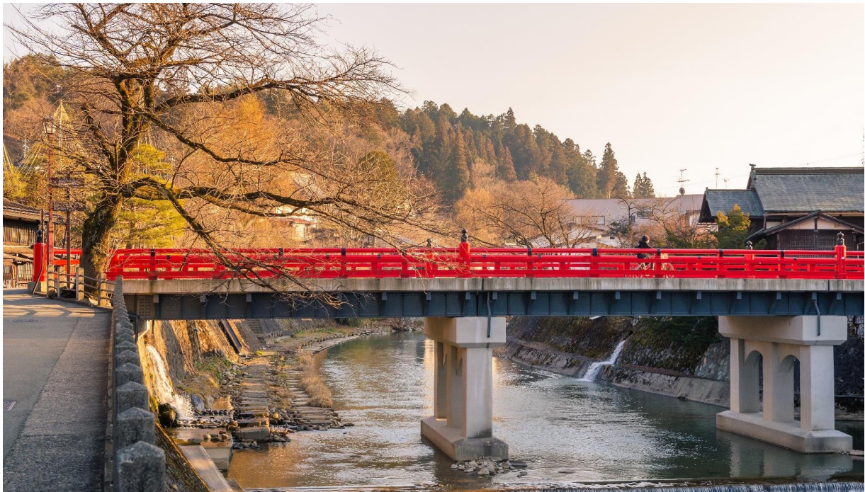
สะพานนากะบาชิ (Nakabashi Bridge) สะพานสีแดง ของย่านเมืองเก่า สะพานทอดข้ามแม่น้ำมิกากา วะที่ไหลผ่านใจกลางเมือง สะพานแห่งนี้ถือเป็นสัญลักษณ์ของเมืองทาคายามา