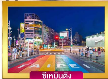
ซีเหมินติง