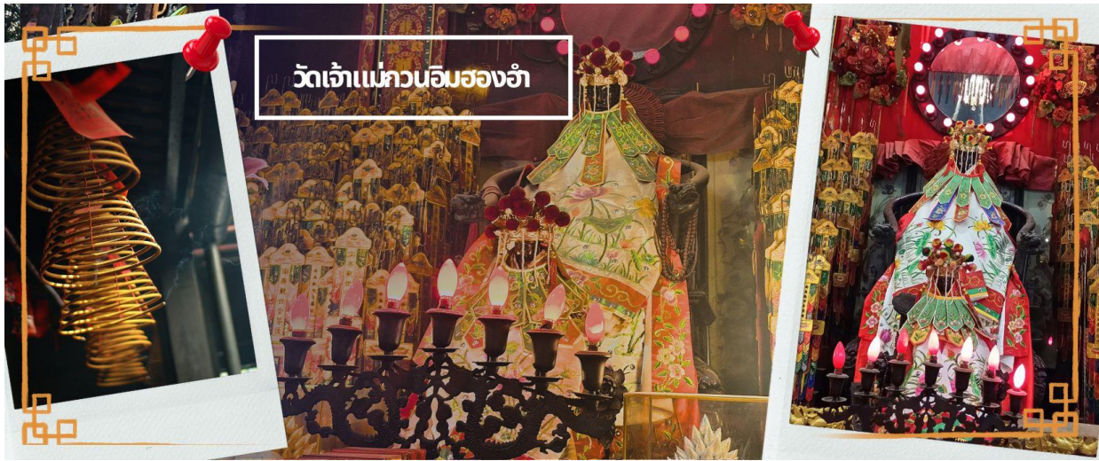
วัดเจ้าแม่ทวนอิมของอำ

CCXH3 ส่องกง กระเช้าทองคำ ไขว้พระ 8 วัดตั้ง 3วัน2คืน สายการบิน CATHAY PACIFIC (CX)