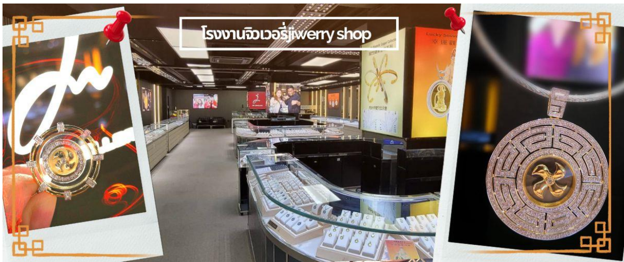
โรงงานจิวเวอรี่jewerry shop

จากนั้นนำท่านชม โรงงานจิวเวอรี่ ซึ่งเป็นโรงงานที่มีชื่อเสียงที่สุดของฮ่องกงในเรื่องการออกแบบเครื่องประดับ อาทิเช่น จี้ และแหวนกำหั้น ที่สวยงามโดดเด่นไม่เหมือนใคร ซึ่งถือกำเนิดขึ้นที่นี่และมีชื่อเสียงที่สุดใช้เป็นเครื่องประดับติดตัว และเสริมดวงชะตา สินค้าทุกชิ้นมีเอกสารรับประกันคุณภาพเปลี่ยน ซ่อม ใต้ตลอดอายุการใช้งาน หากเกิดการชำรุดจากสินค้าไม่ใช่อุบัติเหตุ และนำท่านเลือกซื้อ เครื่องประดับที่ ร้านหยก ซึ่งคนจีนนั้นถือว่าหยกเป็นหิน ที่เป็นตัวแทนของความสวยงามและความบริสุทธิ์ มีความเชื่อว่าหยกมงคล ถ้าพกติดตัวไว้จะอายุยืนและสุขภาพดี