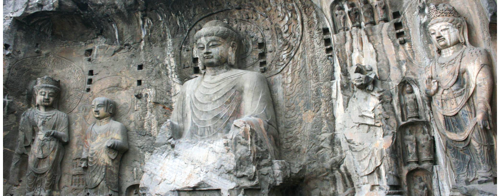
FT-CGOVZ02A - เจิ้งโจว ซื่ออัน สุสานจินซี ถ้ำหินหลงเหมิน 4 วัน 3 คืน - VZ

นำท่านออกเดินทางสู่ เมืองลั่วหยาง หนึ่งใน 8 เมืองหลวงเก่าแก่ของจีน ในสมัยบูเช็กเทียน เคยถูกเปลี่ยนชื่อเป็นเมืองลินตู เมืองหลวงแห่งแรก และแห่งเดียวของราชวงศ์โจว มีดอกไม้ไม้ขึ้นชื่อคือดอกโบตั๋นที่จะบานเพียง 10 วัน ใน 1 ปี (ใช้เวลาเดินทางประมาณ 2 ชั่วโมง) นำท่านเข้าเยี่ยมชม ถ้ำแกะสลักหลงเหมิน หนึ่งในมรดกโลกของเมืองลั่วหยาง เป็นหน้าหินแกรนิตเลียบไปกับแม่น้ำลั่ว ผาแกะสลักนี้มีอายุไม่ต่ำกว่า 1,500 ปี เริ่มสร้างขึ้นในสมัยราชวงศ์เว่ยเหนือ ตลอดจนกระทั่งสมัยราชวงศ์ถัง ตัวหน้าผามีรูปสลักมากมายกว่า 100,000 รูป หนึ่งในพระพุทธรูปแกะสลักที่ใหญ่ที่สุดนั้น กล่าวกันว่าจำลองหน้าตามาจากพระพักตร์ของ บูเช็กเทียน