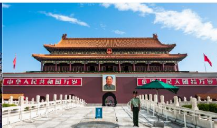
จัดรถเที่ยวอันเหมิน