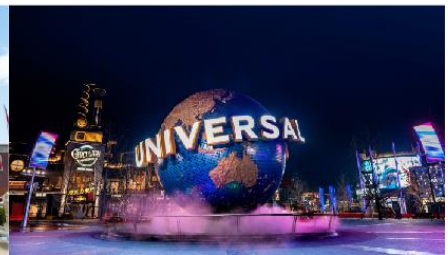
ยูนิเวอร์เซล ปักกิ่ง รีสอร์ท

*ทางบริษัทฯ ขอสงวนสิทธิ์ในการสลับโปรแกรมทัวร์ตามความเหมาะสมขึ้นอยู่กับสถานการณ์หน้างาน โดยคำนึงถึงผลประโยชน์ของลูกค้าเป็นสำคัญ