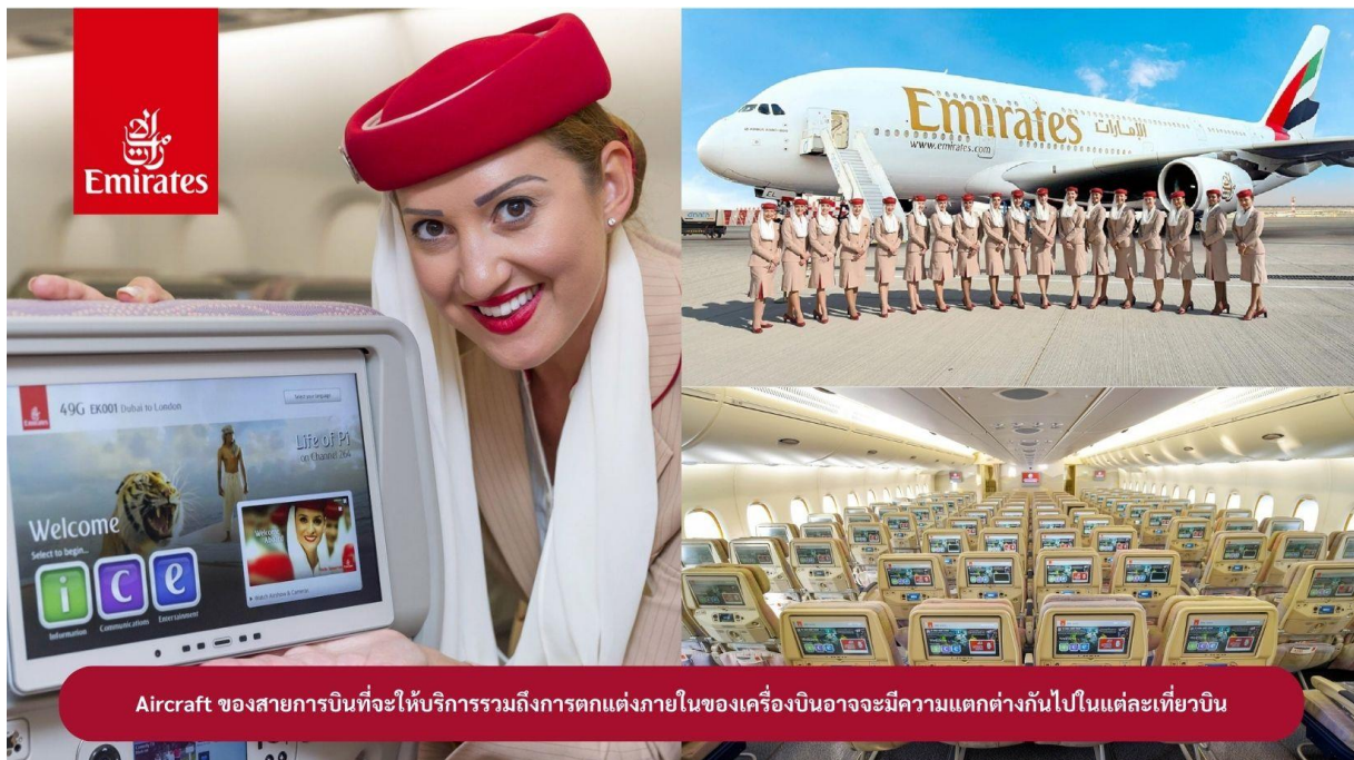
Aircraft ของสายการบินที่จะให้บริการรวมถึงการตกแต่งภายในของเครื่องบินอาจจะมี ความแตกต่างกันไปในแต่ละเที่ยวบิน

22.00 น. !!!! ขณะเดินทางพร้อมกัน ณ สนามบินสุวรรณภูมิ อาคารผู้โดยสารขาออกระหว่างประเทศ ชั้น 4 ประตู 9 แถว T สายการบินเอมิเรตส์ แอร์ไลน์ (EK) เจ้าหน้าที่ให้การต้อนรับและอำนวยความสะดวก