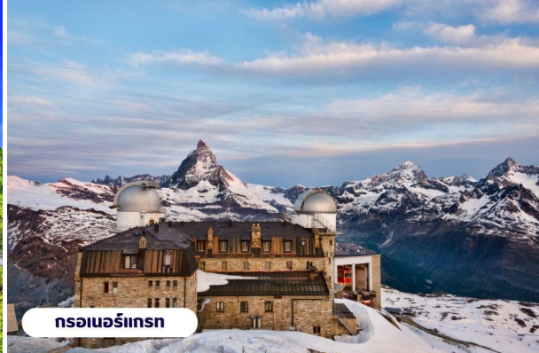
นรอเนอร์กรน