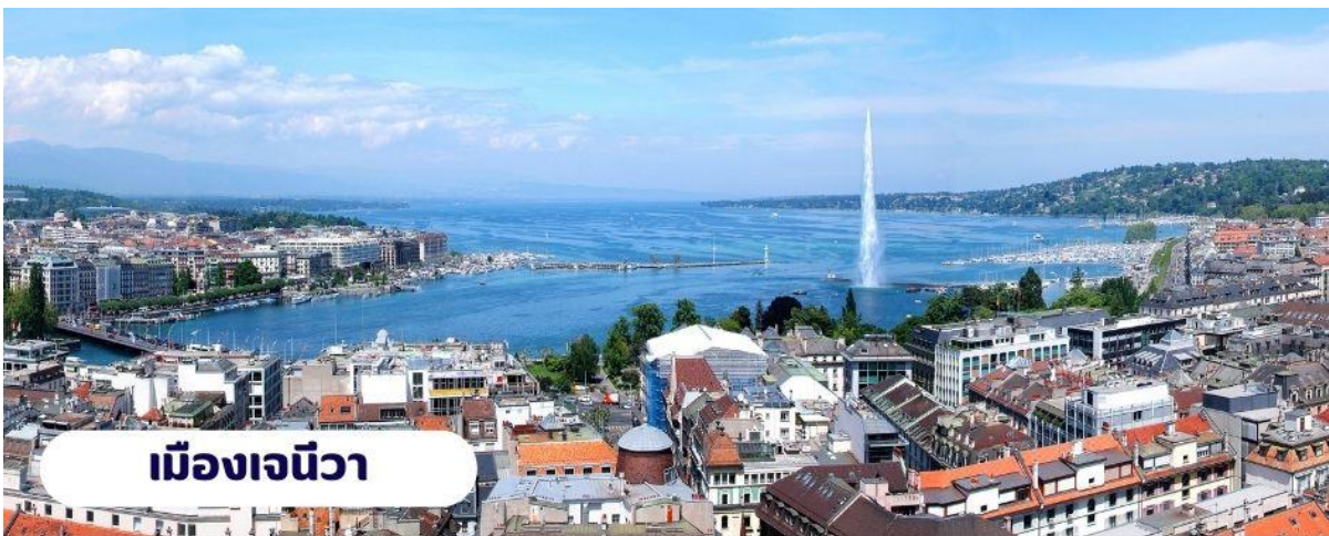
เมืองเจนีวา