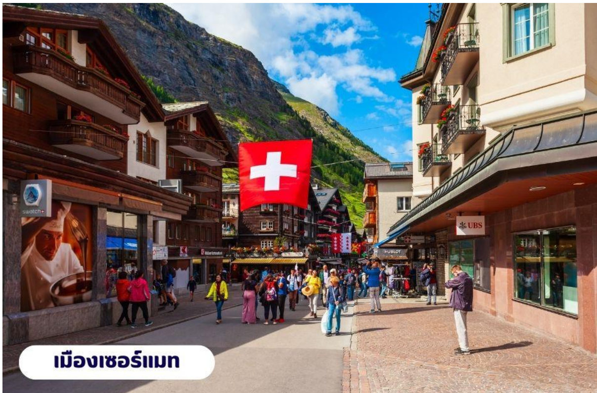
เมืองเซอร์แมท

เช้า บริการอาหารเช้า ณ ห้องอาหารของโรงแรม จากนั้นนำท่านเดินทางสู่ เมืองแทสซ์ (Tasch) ใช้เวลาเดินทางประมาณ 2.30 ชั่วโมง ตั้งอยู่ในประเทศสวิตเซอร์แลนด์ เป็นประเทศขนาดเล็กที่ไม่มีทางออกสู่ทะเล และตั้งอยู่ในทวีปยุโรปตะวันตก ซึ่งมีเทือกเขาแอลป์ ซึ่งเป็นเทือกเขาที่ใหญ่ที่สุดของทวีปยุโรป เลาะเลียบบตามหุบเขา ชมทิวทัศน์สวยอันงดงาม ตลอดเส้นทาง จากนั้นนำท่านเดินทางโดยรถไฟสู่เมืองเซอร์แมท (Zermatt) ใช้เวลาเดินทางประมาณ 15 นาที โดยรถไฟซึ่งเป็นเมืองที่ไม่อนุญาตให้รถยนต์วิ่งและเป็นเมืองที่ได้รับการยกย่องว่า ปลอดภัยที่สุดของโลกตั้งอยู่บนความสูงกว่า 1,620 เมตร ซึ่งเป็นที่ตั้งของยอดเขาแมทเทอร์ฮอร์น ซึ่งเป็นสัญลักษณ์ของสวิตเซอร์แลนด์ เมืองเซอร์แมทเป็นเมืองเล็กๆ หรืออาจจะเรียกได้ว่าเป็นหมู่บ้านก็ได้ เพราะว่ามีประชากรในเมืองไม่ถึง 10,000 คน ทางตอนใต้ของสวิตเซอร์แลนด์กับชายแดนอิตาลี โดยมี Pennine Alps ซึ่งเป็นส่วนหนึ่งของเทือกเขา Alps เป็นเส้นกั้นระหว่าง 2 ประเทศหากพูดถึง Zermatt ก็ต้องนึกถึงยอดเขาแหลมที่มีลักษณะคล้ายปิรามิด ชื่อว่า Matterhorn ที่ตั้งตระหง่านอยู่ใกล้ๆ เมือง มีความสูงถึง 4,478 เมตร สามารถมองเห็นได้จากแทบทุกมุมของเมือง ซึ่ง Matterhorn นี้ถือเป็นสัญลักษณ์ที่สำคัญของ Zermatt