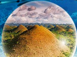
CHOCOLATE HILLS เกาะโมโฮ

เดินทาง 20-24 มี.ค. 67 10-14 / 24-28 เม.ย. 67 5 | 3 วัน | คืน