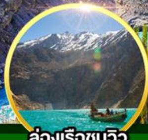
ล่องเรือชมวิว