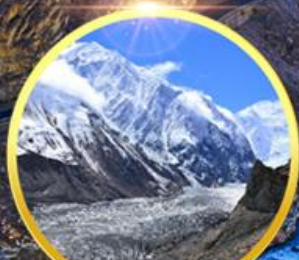
ชมความสวยงาม