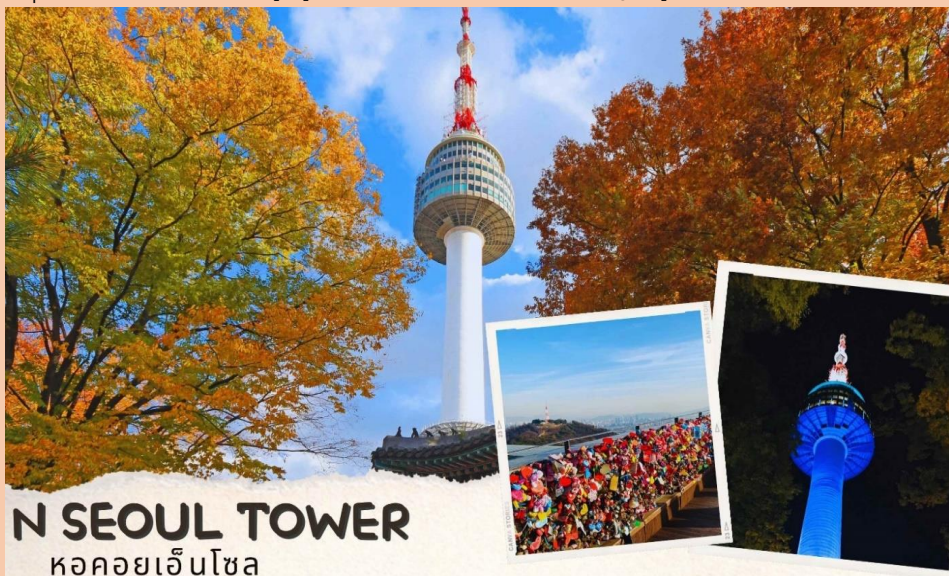
N SEOUL TOWER หอคอยเอ็นโซล

WATER DROP (ครีมหน้าแตก) , SNAIL CREAM (ครีมเมือกหอยทาก) , BOTOX (โบทีออกซ์) , ALOE VERA PRODUCT (ผลิตภัณฑ์จากสมุนไพรวานหางจระเข้) เป็นต้นหลังทานอาหารเย็น จากนั้นนำท่านสู่ หอคอยกรุงโซล N Tower (ไม่รวมค่าลิฟต์) ซึ่งอยู่บริเวณเนินเขานัมซานซึ่งเป็น 1 ใน 18 หอคอยที่สูงที่สุดในโลกที่ฐานของหอคอยมีสิ่งที่น่าสนใจต่างๆ เช่น ศาลาแปดเหลี่ยมปาลกักจอง, สวนสัตว์เล็ก ๆ, สวนพฤกษชาติ, อาคารอนุสรณ์ผู้รักชาติอันสูงชัน อีสระให้ทุกท่านได้เดินเล่นและถ่ายรูปคู่หอคอยตามอัธยาศัยหรือคล้องกัญแจคูรัก