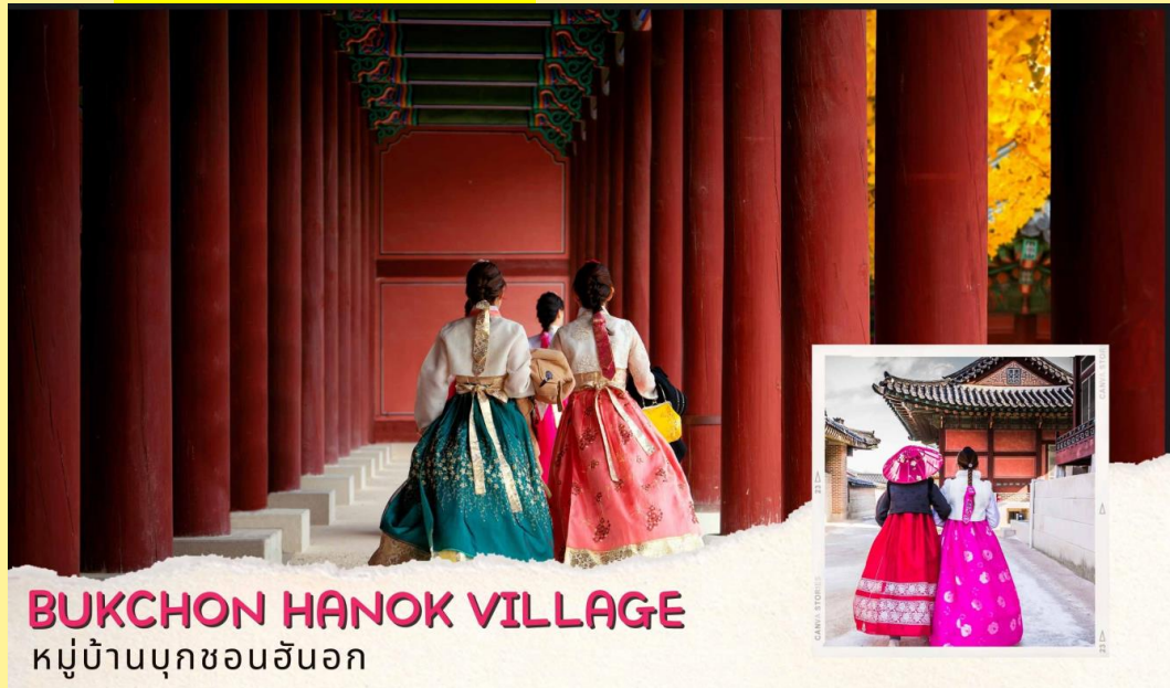
BUKCHON HANOK VILLAGE หมู่บ้านบุกซอนฮันอก

นำท่านชม ศูนย์โสมรัฐบาล (Ginseng) ซึ่งรัฐบาลรับรองคุณภาพว่าผลิตจากโสมที่มีอายุ 6 ปีซึ่งถือว่าเป็นโสมที่มีคุณภาพดีที่สุดในข่วงชีวิตของโสมพร้อมให้ท่านได้เลือกซื้อโสมที่มีคุณภาพดีที่สุดในข่วงชีวิตของโสมและราคาถูกกว่าไทยถึง 2 เท่าเพื่อนำไปบำรุงร่างกายหรือฝากญาติผู้ใหญ่ที่ นำท่านชม ศูนย์น้ำมันสนเข็มแดง (Red Pine) เป็นผลิตภัณฑ์ที่สกัดจากน้ำมันสนมีสรรพคุณช่วยบำรุงร่างกายลดไขมันช่วยควบคุมอาหารและรักษาสมดุลในร่างกายได้เป็นอย่างดี จากนั้นชม พระราชวังเคียงบก ซึ่งเป็นพระราชวังไม้โบราณที่เก่าแก่ที่สุด กว่า 600 ปี ภายในพระราชวังแห่งนี้มีหมู่พระที่นั่งมากกว่า 200 หลัง แต่ได้ถูกทำลายไปมากในสมัยที่ญี่ปุ่นเข้ามาบุกยึด ทั้งยังเคยเป็นศูนย์บัญชาการทางการทหารและเป็นที่พักของกษัตริย์ ปัจจุบันได้มีการก่อสร้างหมู่พระที่นั่งที่เคยถูกทำลายขึ้นมาใหม่ในตำแหน่งเดิม ถ่ายภาพคู่กับพลับพลากลางน้ำเคียงเสวรู ที่ซึ่งเคยเป็นท้องพระโรงออกงานโสมสรสนัชนิดต่างๆ (ให้เวลาท่าน เข้าสู่ชุดฮันบกสวย ๆ หน้าพระราชวังและถ่ายรูปตามอัธยาศัย **ค่าเช่าชุดรวมไม่รวมในค่าทัวร์** )