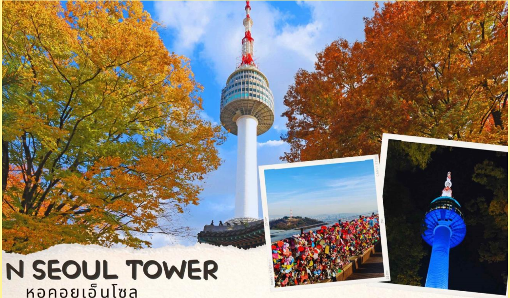
N SEOUL TOWER หอคอยเอ็นโซล

จากนั้นนำท่านไปที่ Seaweed Museum พิพิธภัณฑ์สาหร่ายโซงฮัก เป็นพิพิธภัณฑ์ที่ผลิตและแสดงการเลี้ยงสาหร่ายแบบครบวงจร ซึ่งทางการท่องเที่ยวของประเทศเกาหลีอนุญาตให้นักท่องเที่ยวสามารถเข้าไปเยี่ยมชม และเลือกซื้อสาหร่ายพร้อมทั้งทดลองชิมได้ตามอัธยาศัย นำท่านไปเรียนรู้วิธีการทำ คิมบับ(ข้าวห่อสาหร่าย) อาหารง่ายๆที่คนเกาหลีนิยมรับประทานโดยการนำข้าวสุกและส่วนผสมอื่นๆหลากหลายชนิด เช่น แดงกวาง แครอท ผักโขม ไข่เจียว ปูอัด เป็นต้น แล้วแต่วัตถุดิบที่ท่านสะดวก วางแผ่นบนแผ่นสาหร่ายแล้วม้วนเป็นแท่งยาวๆ จากนั้นหั่นเป็นชิ้นพอดีคำ ชาวเกาหลีนิยมรับประทานคิมบับระหว่างการปิกนิก หรืองานกิจกรรมกลางแจ้ง หรือรับประทานเป็นอาหารกลางวันเบาๆ โดยเสิร์ฟกับหัวไชเท้าดองและกิมจิ นอกจากนี้คิมบับยังเป็นอาหารนากลับบ้านที่เป็นที่นิยมทั้งในเกาหลีและต่างประเทศ นำท่านขึ้นภูเขาหนัมซาน เป็นที่ตั้งของ หอคอยเอ็น โซลส์ ทาวเวอร์ (N SEOUL TOWER)