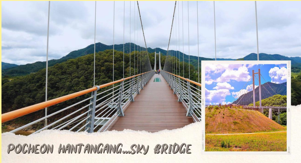
POCHEON HANTANGANG...SKY BRIDGE

08.50 น. เดินทางถึงท่าอากาศยานนานาชาติอินชอนประเทศเกาหลีใต้ (เวลาท้องถิ่นเร็วกว่าไทย 2 ชม.) นำท่านไป หุบเขาศิลปะโพซอน(Pocheon Art Valley) เป็นสถานที่ท่องเที่ยวที่ดัดแปลงมาจากเหมืองหินแกรนิตเก่า ที่มีลักษณะเป็นหุบเขา โดยนำเอาผลงานศิลปะและประติมากรรมมาสร้างและจัดสรรกัน อย่างลงตัว อยู่ไม่ไกลจากกรุงโซลมากนัก ด้วยระยะทางแค่ 60 กิโลเมตรเท่านั้น ทำให้มีบรรยากาศแปลกใหม่ แตกต่างและสวยงาม มีละครซีรี่ส์เข้ามาถ่ายทำกันหลายเรื่อง จนมีชื่อเสียงโด่งดัง ทำให้ในแต่ละปีจะมีนักท่องเที่ยวเดินทางมาที่นี่กันมากขึ้นเรื่อยๆ หนึ่งในไฮไลท์ของที่นี่คือส่วนทะเลสาบที่มีน้ำใสเขียวมรกต ตั้งอยู่ด้านบนของหุบเขาด้วยความสูง 340 เมตร การเดินทางขึ้นไปนั้นมีด้วยกัน 2 วิธีก็คือ การนั่งรถรางขึ้นไป (เสียค่าบริการในการขึ้น) และอีกวิธีหนึ่งก็คือการเดินเท้าขึ้นไปก็จะได้สัมผัสกับทัศนียภาพอย่างใกล้ชิดเมื่อขึ้นไปบนหุบเขาแล้วจะเห็นหน้าผาหินแกรนิตขนาดใหญ่โอบล้อมทะเลสาบสีเขียวมรกตที่มีน้ำใสเย็น ยิ่งในช่วงค่านั้นจะมีการเปิดไฟเปลี่ยนสีไปมาแสงไฟหลากสีกระทบกับหินบนหน้าผาแสงสาดส่องกระทบลงบนผิวน้ำนั้นโรแมนติกสุดๆ