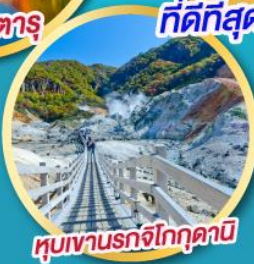
หุบเขานรกจิกุกุดานิ

พิเศษ ! บุฟเฟ่ต์ Nanda ที่ดีที่สุด ใน ซัปโปโร