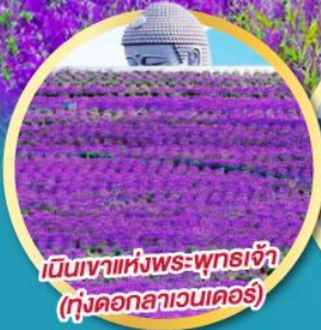
เนินเขาแห่งพระพุทธรเจ้า (ทุ่งดอกลาเวนเดอร์)

บุฟเฟ่ต์เมลอนหอมหวานว่า กิจกรรมเก็บเชอร์รี่สดๆ จากต้น