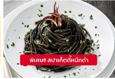
พิเศษ!! สปาเก็ตตี้หมึกดำ

Highlight ! เมื่อเยือนเกาะเวนิส เมนูที่ขึ้นชื่อและหากได้มาต้องได้ลิ้มลอง สปาเก็ตตี้ผัดซอสหมึกดำที่คลุกเคล้ากับความหอมนุ่มนัวกับบรรยากาศ สุดคลาสสิคฉบับอิตาเลียนต้นตำรับเวนิส