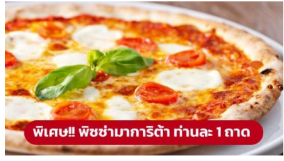
พิเศษ!! พิซซ่ามาการิตต้า ท่านละ 1 ถาด

เที่ยง ๑๐ รับประทานอาหารเที่ยง (มื้อที่1) เมนูพิเศษ!! พิซซ่ามาการิตต้า นำท่านเดินทางสู่ เมืองเวนิสเมสเตร (Venice Mestre) (ระยะทาง 264 ก.ม. / 4 ชม.) เป็นย่านเมืองเก่าแก่ที่มีความสวยงามและแสดงให้เห็นถึงความเชื่อมโยงยาวนานแก่