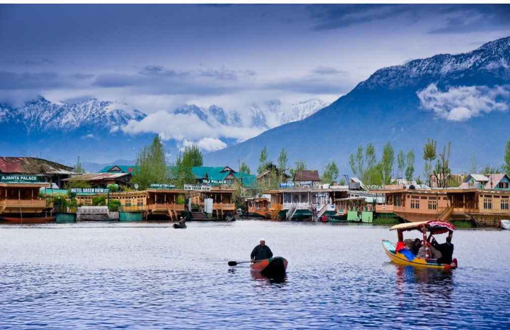
ล้อมโดยรอบ ในสมัยที่ถูกปกครองโดยราชวงศ์โมกุล มีการจัดทำผังเมืองขึ้นมาใหม่ จึงทำให้แคชเมียร์เป็น

09.10 เดินทางถึง ท่าอากาศยานศรีนาคา รัฐแคชเมียร์ ประเทศอินเดีย หลังผ่านขั้นตอนการตรวจหนังสือเดินทาง และตรวจรับสัมภาระเรียบร้อยแล้ว นำท่านสู่ตัว เมืองศรีนาคา (SRINAGAR) ซึ่งเป็นเมืองหลวงของแคชเมียร์ ประกอบด้วยทะเลสาบขนาดใหญ่ คือ ทะเลสาบดาล และ ทะเลสาบนากิน ด้านหลังมีเทือกเขาโอบล้อมโดยรอบ ในสมัยที่ถูกปกครองโดยราชวงศ์โมกุล มีการจัดทำผังเมืองขึ้นมาใหม่ จึงทำให้แคชเมียร์เป็น