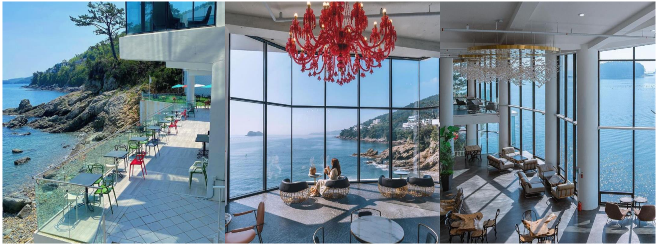
เดินไปไม่ไกลกันนัก ยังเป็นจุดที่ตั้งของ คาเฟ่ริมทะเล RAFIK อาคารสีขาวสไตล์โมเดิร์นตั้งอยู่บนเนินเขาริมทะเล มองเห็นวิวทะเลสวยงามมาก มีมุมนั่งหลากหลายอารมณ์ เครื่องดื่มขนมมีให้เลือกครบ (ราคาทั่วไปรวมค่าเบเกอรี่ เครื่องดื่ม และอาหาร)