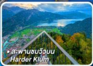
• สะพานชมวิวน Harder Klum