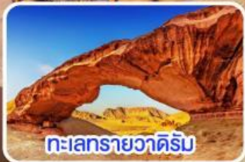
ทะเลทรายวาดีรัม