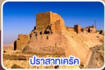
ปราสาทเคิร์ก