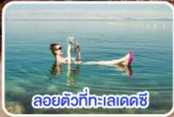
ลอยตัวที่ทะเลเดดซี