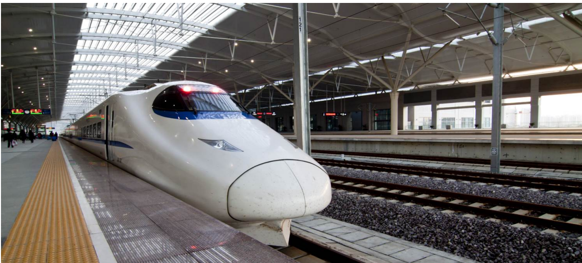
SHCZSHEHRB1 ฉางไปชาน ผ่านจีน เส้นหยาง ฮาร์บิน 6 วัน 5 คืน มิ.ย.-ก.ย.67 CZ (240424)

นำท่านเดินทางสู่ ถนนคนเดินจงเจีย ในอดีตเคยเป็นที่ตั้งของสถานีรถไฟแห่งแรกของเมือง เคยเป็นเส้นทางขนส่งยุทธภัณฑ์และทหารในสมัยสงคราม ปัจจุบันเป็นที่ตั้งของที่ทำการธนาคารและห้างร้านต่างๆ จากนั้นนำท่านสู่ สถานีรถไฟเส้นหยาง เพื่อโดยสาร รถไฟความเร็วสูง สู่ ฉางไปชาน (ใช้ระยะเวลาการเดินทางประมาณ 4 ชั่วโมง) ภูเขาฉางไปชานเป็นภูเขาที่อยู่ระหว่างชายแดนจีนกับเกาหลีเหนือ (ทั้งนี้อาจจะมีการเปลี่ยนแปลงขบวนรถไฟ) หมายเหตุ: เพื่อความรวดเร็วในการขึ้น - ลงรถไฟ กระเป๋าเดินทาง และสัมภาระของแต่ละท่านจำเป็นต้องลากด้วยตนเอง จึงควรเลือกใช้กระเป๋าเดินทางแบบคันชักล้อลากที่มีขนาดไม่ใหญ่จนเกินไป