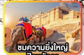
ชมความยิ่งใหญ่ ป้อมอัครา