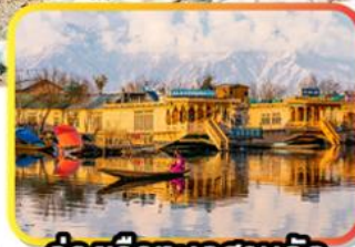
ล่องเรือทะเลสาบคิล