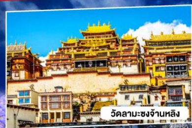
วัดลามะซงจ้านหลิ่ง