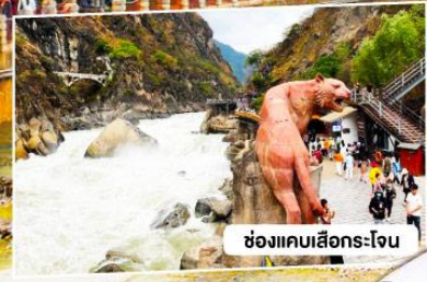
ช่องแคบเสือกระโจน