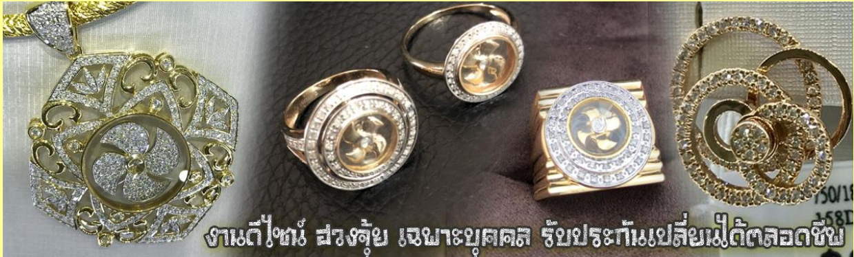
งานดีไซน์ สวยล้ำ เฉพาะบุคคล รับประกันเปลี่ยนไม่กัดตลอดชีพ

นำท่านเยี่ยมชม โรงงานจิวเวลรี่ ที่ขึ้นชื่อของฮ่องกงพบกับงานดีไซน์ที่ได้รับรางวัลอันดับยอดเยี่ยม และใช้ในการเสริมดวงเรื่อง ดวงจัญนำความโชคดี มั่งคั่งแก่ผู้สวมใส่ ซึ่งในเมืองไทยก็ได้นิยมแพร่หลายออกไป ไม่ว่าจะเป็นกลุ่ม ดารา นักการเมือง พ่อค้าแม่ขายที่ประกอบธุรกิจ เจ้าของกิจการห้างร้านต่างๆ ซึ่งเชื่อกันว่าจะนำสิ่งดี ๆ ปิดเป่าสิ่งชั่วร้ายให้กับบุคคลที่สวมใส่ ซึ่งจะมีมากมายหลายชนิด เช่น จี้ก้อน หุ่นรุ่นต่างๆ นาฬิกาข้อมือ (ซึ่งผู้สวมใส่จะได้รับการดูลายมือจากซินเซปประจำร้าน เพื่อนำวิธีการเสริมดวงในการสวมใส่โดยไม่คิดค่าบริการ)