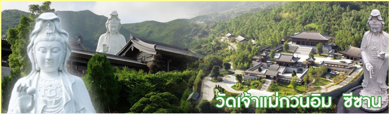
วัดเจ้าแม่กวนอิม ชีซาน

วัดชีซาน หลายคนที่เคยไปเที่ยวฮ่องกงมาแล้ว อาจจะยังไม่เคยเยือนวัดชีซาน หรือ Tsz Shan Monastery เป็นวัดที่มีเจ้าแม่กวนอิมองค์ใหญ่เป็นอันดับสองของโลก มีความสูงถึง 76 เมตร ตั้งอยู่บนเนื้อที่กว่า 29 ไร่ ในเกาะฮ่องกง โดยมีนาย ลี กาชิง มหาเศรษฐีชื่อดังของฮ่องกง บริจาคเงินสร้างวัดถึง 193 ล้านดอลลาร์เลยทีเดียว