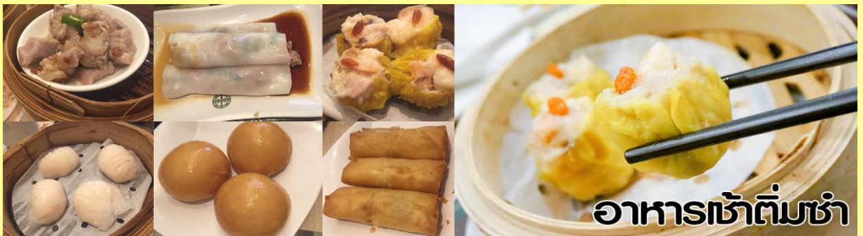
อาหารเช้าต้มซ่า