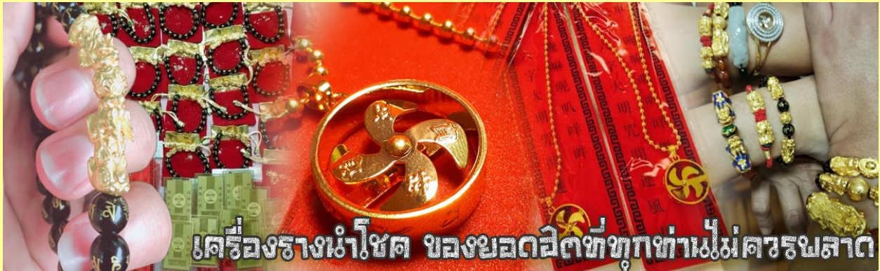
เครื่องรางนำโชค ของขลังมีฤทธิ์ทุกท่านไม่ควรมองข้าม

จากนั้นนำท่านสู่ ร้านหยก ชมความงามปีเซียะ ที่เชื่อกันว่าเป็นวัตถุมงคลยอดนิยม ที่มีการนำมาบูชา เพื่อให้ช่วยป้องกันสิ่งชั่วร้าย เรียกทรัพย์สินเงินทองให้ไหลมาเทมา และกักเก็บทรัพย์นั้นไม่ให้รั่วไหลออกไปไหนได้ ชาวจีนโบราณเชื่อกันว่า ปีเซียะเป็นสัตว์ประหลาดที่รวมลักษณะของสัตว์มงคลทั้ง 5 ชนิดไว้ด้วยกัน ได้แก่ มังกร พญาราชสีห์หรือสิงโต, อินทรี, กวาง, และแมว โดยตามตำนานเล่าว่า ปีเซียะเป็นลูกมังกรตัวที่ 9 (เทพแห่งโชคลาภ) ของพญามังกรสวรรค์ มีชื่อเรียกด้วยกันหลายชื่อไม่ว่าจะเป็น “เทียนลก (กวางสวรรค์)” เป็นชื่อเดิม ส่วนเงินกวางตุ้งจะเรียกว่า “เผ่เฮ่า” และคนจีนแต้จิ๋วจะเรียกว่า “ผีซิว”