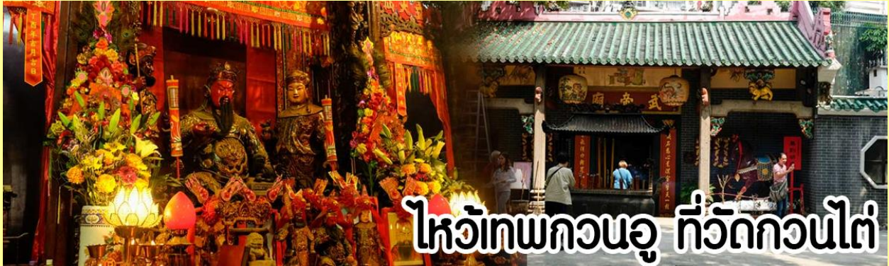
ไหว้เทพกวนอู ที่วัดกวนไต

หลังจากนั้นขอพรเทพเจ้ากวนอู ณ วัดกวนไต วัดเก่าแก่สร้างขึ้นในปีพ.ศ. 2434 เป็นวัดเดียวในเกาลูนที่บูชาเทพ เจ้ากวนอูเป็นเทพผู้ยิ่งใหญ่ เทพเจ้าแห่งความซื่อสัตย์ โชคลาภ บารมี