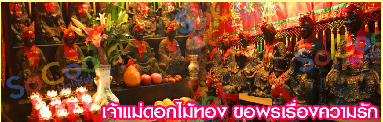
เจ้าแม่ดอกไม้ทอง ขอพรเรื่องความรัก