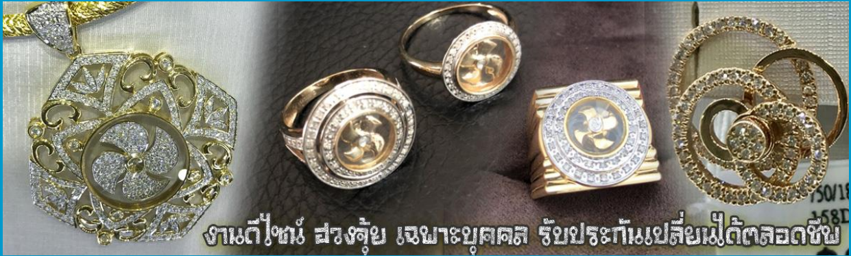
งานตีพิมพ์ สว่างคู่ย เจาะบุคคตล รับประกันแท้เสียไม่ได้ตลอดชีพ

จากนั้นนำท่านสู่ ร้านหยก ชมความงามปีเซียะ ที่เชื่อกันว่าเป็นวัตถุมงคลยอดเยี่ยม ที่มีการนำมาบูชา เพื่อให้ช่วยป้องกันสิ่งชั่วร้าย เรียกทรัพย์เงินทองให้ไหลมาเทมา และกักเก็บทรัพย์นั้นไม่ให้รั่วไหลออกไปไหนได้ ชาวจีนโบราณเชื่อกันว่า ปีเซียะเป็นสัตว์ประหลาดที่รวมลักษณะของสัตว์มงคลทั้ง 5 ชนิดไว้ด้วยกัน ได้แก่ มังกร พญาราชสีห์หรือสิงโต, อินทรี, กวาง, และแมว โดยตามตำนานเล่าว่า ปีเซียะเป็นลูกมังกรตัวที่ 9 (เทพแห่งโชคลาภ) ของพญามังกรสวรรค์ มีชื่อเรียกด้วยกันหลายชื่อไม่ว่าจะเป็น “เทียนลก (กวางสวรรค์)” เป็นชื่อเดิม ส่วนจีนกลางจะเรียกว่า “เผ่เฮ่า” และคนจีนแต้จิ๋วจะเรียกว่า “ผีซิว”