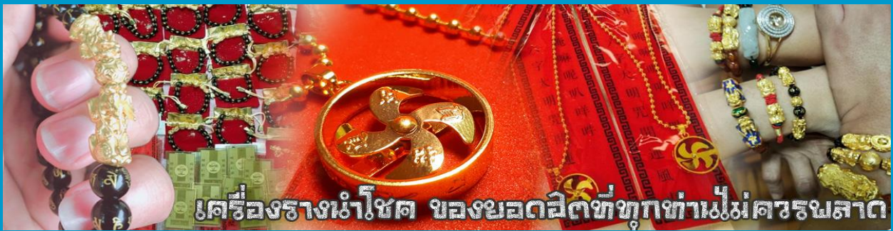
เครื่องรางนำโชค ของยอดฮิตที่ทุกท่านไม่ควรพลาด

จากนั้นนำท่านสู่ ร้านหยก ชมความงามปีเซียะ ที่เชื่อกันว่าเป็นวัตถุมงคลยอดเยี่ยม ที่มีการนำมาบูชา เพื่อให้ช่วยป้องกันสิ่งชั่วร้าย เรียกทรัพย์เงินทองให้ไหลมาเทมา และกักเก็บทรัพย์นั้นไม่ให้รั่วไหลออกไปไหนได้ ชาวจีนโบราณเชื่อกันว่า ปีเซียะเป็นสัตว์ประหลาดที่รวมลักษณะของสัตว์มงคลทั้ง 5 ชนิดไว้ด้วยกัน ได้แก่ มังกร พญาราชสีห์หรือสิงโต, อินทรี, กวาง, และแมว โดยตามตำนานเล่าว่า ปีเซียะเป็นลูกมังกรตัวที่ 9 (เทพแห่งโชคลาภ) ของพญามังกรสวรรค์ มีชื่อเรียกด้วยกันหลายชื่อไม่ว่าจะเป็น “เทียนลก (กวางสวรรค์)” เป็นชื่อเดิม ส่วนจีนกลางจะเรียกว่า “เผ่เฮ่า” และคนจีนแต้จิ๋วจะเรียกว่า “ผีซิว”