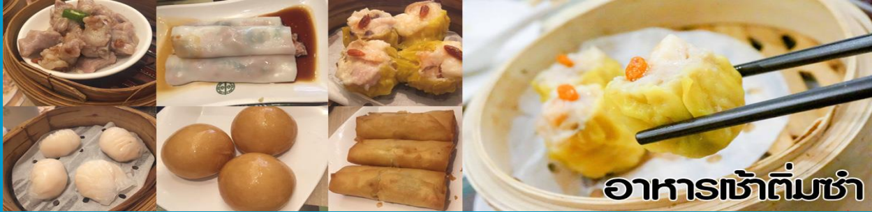
อาหารเช้าติ่มซำ

จากนั้นนำคณะเดินทางเข้าสู่ เกาะลันเตา พาทุกท่านสักการะพระใหญ่เทียนกาน ซึ่งถือได้ว่าเป็นแหล่งท่องเที่ยวอันมีเอกลักษณ์ระดับโลกของฮ่องกง นำคณะขึ้นสู่ด้านบนโดย กระเช้านองปิง 360 (หากทัศนวิสัยไม่เอื้ออำนวย เช่น ฝนตกหนัก มีลมแรง กระเช้าอาจปิดให้บริการ เราจะนำท่านขึ้นสักการะพระใหญ่โดยรถได้เช่นกัน ทั้งนี้เพื่อความปลอดภัยของลูกดี เป็นสำคัญ สงวนสิทธิ์ไม่คืนเงินค่ากระเช้า) ให้ท่านได้สักการะ พระใหญ่เกาะลันเตา ซึ่งเป็นพระพุทธรูปทองสัมฤทธิ์กลางแจ้งใหญ่ที่สุดในโลกองค์พระทำขึ้นจากการเชื่อมแผ่นทองสัมฤทธิ์กว่า 200 แผ่นเข้าด้วยกันหันพระพักตร์ไปทางด้านทะเลจีนใต้และมองอย่างสงบลงมายังหุบเขา และโชดหินเบื้องล่าง ให้ท่านชมความงดงามตามอัธยาศัย