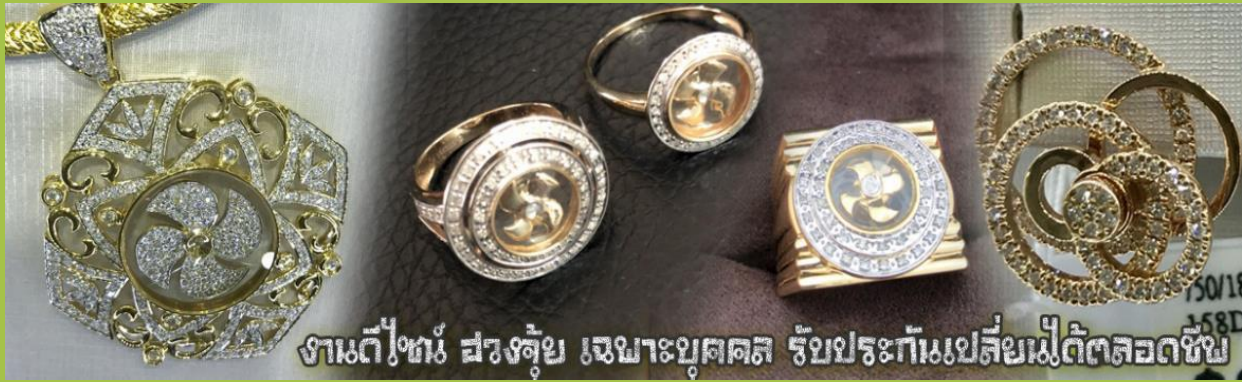
งานตีใหม่ สวยล้ำ เฉพาะบุคคล รับประกันเปลี่ยนไม่ตัดลดชีพ

จากนั้นนำท่านสู่ ร้านหยก ชมความงามปีเซียะ ที่เชื่อกันว่าเป็นวัตถุมงคลยอดเยี่ยม ที่มีการนำมาบูชา เพื่อให้ช่วยป้องกันสิ่งชั่วร้าย เรียกทรัพย์สินเงินทองให้ไหลมาเทมา และกักเก็บทรัพย์นั้นไม่ให้รั่วไหลออกไปไหนได้ ชาวจีนโบราณเชื่อกันว่า ปีเซียะเป็นสัตว์ประหลาดที่รวมลักษณะของสัตว์มงคลทั้ง 5 ชนิดไว้ด้วยกัน ได้แก่ มังกร พญาราชสีห์หรือสิงโต, อินทรี, กวาง, และแมว โดยตามตำนานเล่าว่า ปีเซียะเป็นลูกมังกรตัวที่ 9 (เทพแห่งโชคลาภ) ของพญามังกรสวรรค์ มีชื่อเรียกด้วยกันหลายชื่อไม่ว่าจะเป็น “เทียนลก (กวางสวรรค์)” เป็นชื่อเดิม ส่วนจีนกวางตุ้งจะเรียกว่า “เผ่ฮ่า” และคนจีนแต้จิ๋วจะเรียกว่า “ผีชีว” และยังมีจำหน่ายยาสมุนไพรบำรุงเพิ่มความแข็งแรงตามความเชื่อของคนฮ่องกง