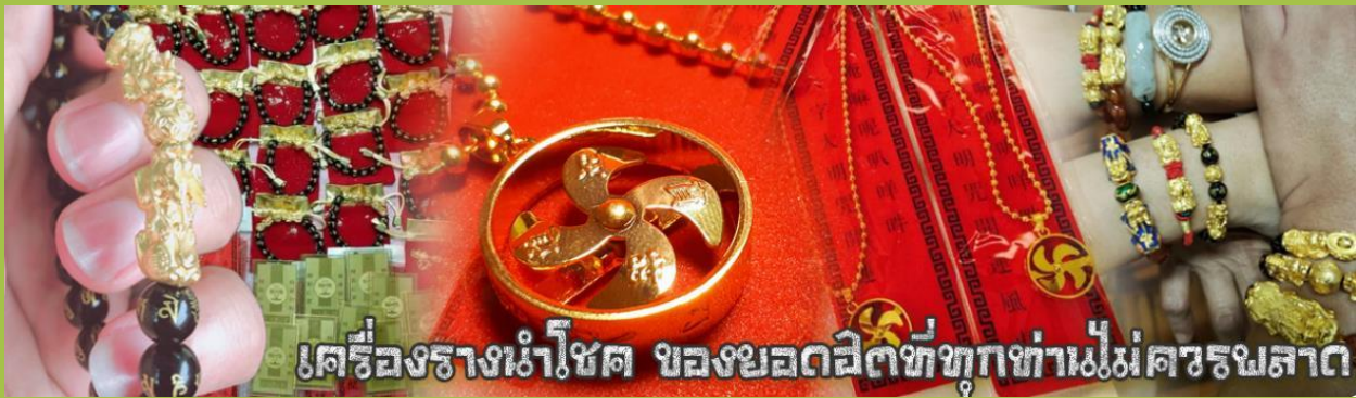
เครื่องรางนำโชค ของยอดฮิตที่ทุกท่านไม่ควรพลาด

จากนั้นนำท่านสู่ ร้านหยก ชมความงามปีเซียะ ที่เชื่อกันว่าเป็นวัตถุมงคลยอดเยี่ยม ที่มีการนำมาบูชา เพื่อให้ช่วยป้องกันสิ่งชั่วร้าย เรียกทรัพย์สินเงินทองให้ไหลมาเทมา และกักเก็บทรัพย์นั้นไม่ให้รั่วไหลออกไปไหนได้ ชาวจีนโบราณเชื่อกันว่า ปีเซียะเป็นสัตว์ประหลาดที่รวมลักษณะของสัตว์มงคลทั้ง 5 ชนิดไว้ด้วยกัน ได้แก่ มังกร พญาราชสีห์หรือสิงโต, อินทรี, กวาง, และแมว โดยตามตำนานเล่าว่า ปีเซียะเป็นลูกมังกรตัวที่ 9 (เทพแห่งโชคลาภ) ของพญามังกรสวรรค์ มีชื่อเรียกด้วยกันหลายชื่อไม่ว่าจะเป็น “เทียนลก (กวางสวรรค์)” เป็นชื่อเดิม ส่วนจีนกวางตุ้งจะเรียกว่า “เผ่ฮ่า” และคนจีนแต้จิ๋วจะเรียกว่า “ผีชีว” และยังมีจำหน่ายยาสมุนไพรบำรุงเพิ่มความแข็งแรงตามความเชื่อของคนฮ่องกง