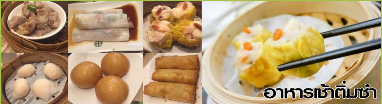
อาหารเช้าต้มซ่า

เช้า รับประทานอาหารเช้า (ต้มซ่า) ณ กั๊ดตาตาร