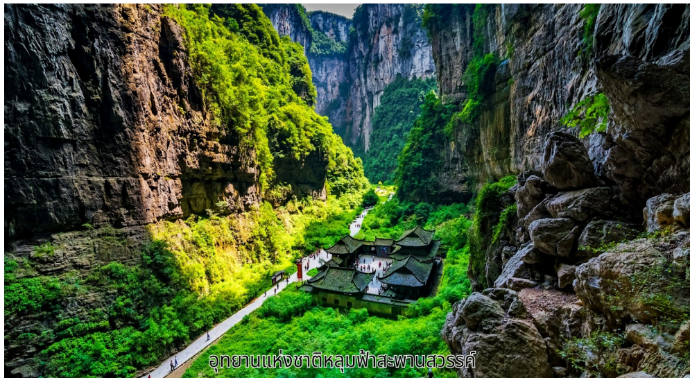
อุทยานแห่งชาติหลุมฟ้าสะพานสวรรค์

นำท่านชม อุทยานแห่งชาติหลุมฟ้าสะพานสวรรค์ (มรดกโลก) แหล่งท่องเที่ยวทางธรรมชาติแหล่งใหม่ล่าสุดที่ได้รับการรับรองจากยูเนสโก ให้เป็นมรดกโลกทางธรรมชาติในปี ค.ศ.2007 อุทยานหลุมฟ้า-สะพานสวรรค์เคย