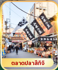
ตลาดปลาชิกิจิ