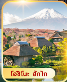
ไอซึเนะ ฮักโก