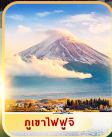
กุเซาฟฟูจิ