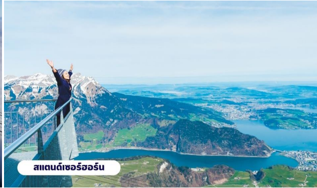
สแตนดาร์ดเซอร์ฮอร์น

เที่ยง ๑๐๑ บริการอาหารกลางวัน ณ ภัตตาคาร จากนั้นนำท่านเดินทางสู่ เมืองมิลาน (MILAN) ใช้เวลาเดินทางประมาณ 4 ชั่วโมง เมืองสำคัญในภาคเหนือของประเทศอิตาลี ตั้งอยู่ในแคว้นที่ราบลอมบาร์ดีเป็น เมืองที่มีชื่อเสียงในด้านแฟชั่นและศิลปะ ซึ่งมิลานถูกจัดให้เป็นเมืองแฟชั่นในลักษณะเดียวกับ นิวยอร์ก ปารีส ลอนดอน และ โรม