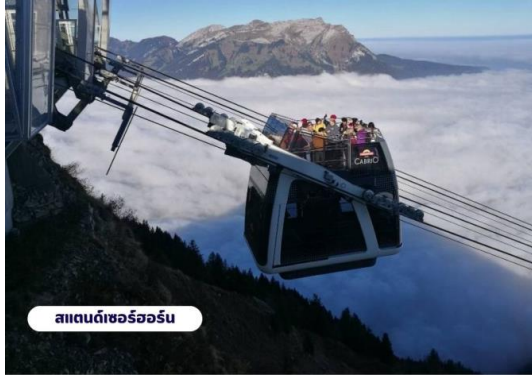
สแตนดาร์ดเซอร์ฮอร์น

เขาท่านจะสามารถมองเห็นวิวแบบ 360 องศา จากนั้นให้ท่านได้เพลิดเพลินกับความสวยงามของธรรมชาติและทัศนียภาพที่งดงาม