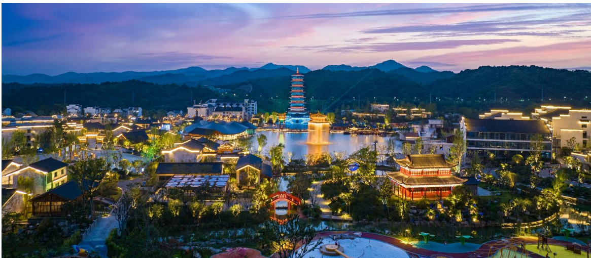
ค่ำ รับประทานอาหารค่ำ ณ ภัตตาคาร (มื้อที่ 6)

นำท่านเดินทางสู่ อุ๋นหนี่โจว แหล่งท่องเที่ยวแห่งใหม่ที่ผสมผสานระหว่างอดีตและปัจจุบัน รายล้อมไปด้วย บ้านเรือนสถาปัตยกรรมแบบเจียงหนาน (บริเวณหังโจว ซูโจว) เอกลักษณ์แบบจีนอันทรงคุณค่า และจะงดงามยิ่งขึ้น ยามพระอาทิตย์ตกดิน เมื่อแต่ละอาคารเปล่งปลั่งด้วยแสงไฟไปทั่วทั้งบริเวณ นำท่านชม การแสดงไฟ โดยนักแสดงมืออาชีพที่จะเอาสะเกิดไฟมาออกกลดลายเป็นแสงสีทอง