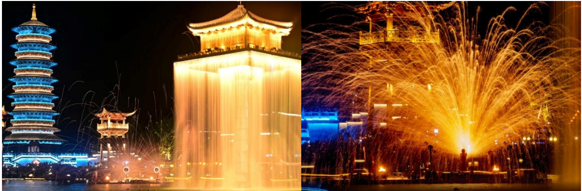
จากนั้นนำท่านเดินทางเข้าสู่ที่พักในเมืองอุ๊หยวน

การแสดงอาจมีการซ่อมบำรุงหรืองดแสดง เนื่องจากการซ่อมบำรุงหรือจากสภาพอากาศ ทางบริษัทฯ ขอเปลี่ยนโปรแกรมเป็นการเดินเที่ยว ถ่ายรูปภายในแทน และทางบริษัทฯ ขอสงวนสิทธิ์ไม่คืนเงินใดๆทั้งสิ้น โดยยึดตามประกาศจากทางอุทยานเป็นสำคัญโดยที่ไม่แจ้งให้ทราบล่วงหน้า