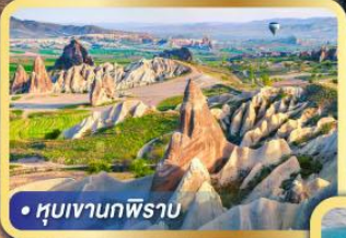
• หุบเขานกพิราบ