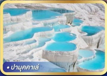
• ปามุกคาเล่