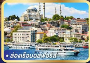
• ล่องเรือบอสฟอรัส