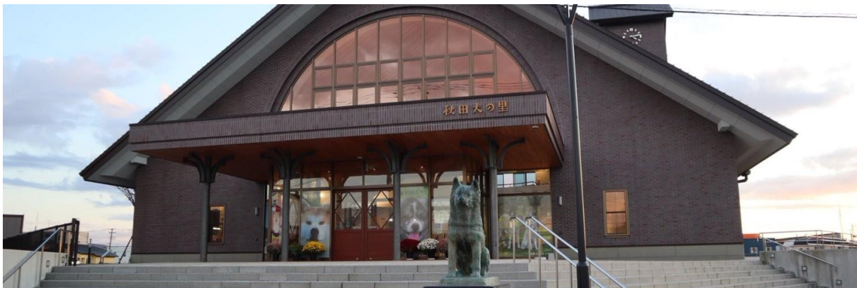
GO2AOJ-JL005 – AOMORI AKITA SENDAI AUTUMN 7D 5N

อาคิตะ อินุ โนะซาโตะ (Akita inu no Sato) “สุนัขพันธุ์อะคิตะ” หรือที่เรียกกันว่า อะคิตะอินุ (Akita-Inu) ซึ่งมีถิ่นกำเนิดอยู่ในแถบโอดาเตะ (Odate) จังหวัดอะคิตะ (Akita) เป็นสุนัขสายพันธุ์ญี่ปุ่นสุดน่ารักที่กำลังได้รับความนิยมเพิ่มขึ้นเรื่อยๆ ทั้งในญี่ปุ่นเองและในต่างประเทศ เป็นแหล่งท่องเที่ยวที่น่าสนใจพันธุ์อะคิตะมาเป็นจุดขายสร้างโดยจำลองแบบมาจากสถานีรถไฟชิบูยะ ภายในอาคารแห่งนี้นอกจากจะมีห้องจัดแสดงตัวอย่างสุนัขพันธุ์อะคิตะให้ได้ชมกันแล้ว ยังมีร้านจำหน่ายสินค้าของฝากที่ระลึก และมีโซนพื้นที่สำหรับกิจกรรมต่างๆ อีกด้วย