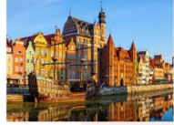
เมืองกตังส์