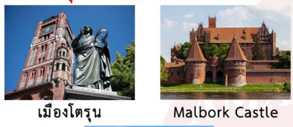
เมืองโตรุน Malbork Castle

DAY3 โตรุน-มาลบอร์ก-ปราสาทมาลบอร์ก-กตังส์