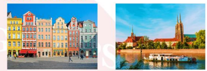
เมืองวรอตซวาฟ ล่องเรือชมเกาะทัมสกี

** พักที่ HP Plaza Hotel 4* หรือเทียบเท่า **