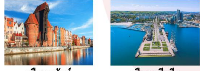
เมืองกตังส์ เมืองกตึเนีย