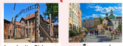
Auschwitz-Birkenau เมืองคราคูฟ

** พักที่ Golden Tulip Krakow Kazimierz Hotel 4* หรือเทียบเท่า **