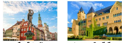
เมืองโปซนัน ปราสาททอมพีเรียล

** พักที่ Vivaldi Hotel 4* หรือเทียบเท่า **