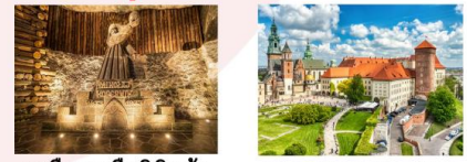
เหมืองเกลือวิลิชก้า Wawel Cathedral

** พักที่ Golden Tulip Krakow Kazimierz Hotel 4* หรือเทียบเท่า **