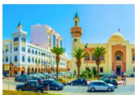
เมืองสแฟกซ์

** พักที่ Radisson Hotel Sfax 5* หรือเทียบเท่า **