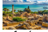
เมืองคาร์เซจ

17.15 น. ออกเดินทางสู่อิสตันบูล ประเทศตุรกี เที่ยวบิน TK664 22.10 น. เดินทางถึงสนามบินอิสตันบูล และเปลี่ยนเครื่อง