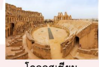
โคลอสเซียม