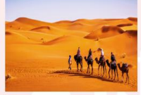
ทะเลทรายซาฮารา

** พักที่ Sahara Hotel 4* หรือเทียบเท่า **