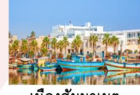
เมืองฮัมมาเมต

** พักที่ Radisson Blu Hammamet Hotel 5* หรือเทียบเท่า **