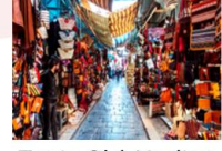
Tunis Old Medina