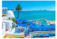
Sidi Bou Said

** พักที่ Continental Hotel 5* หรือเทียบเท่า **