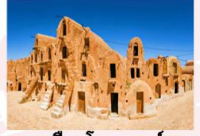
เมืองโทรเซอร์

** พักที่ Tui Magic Hotel Palm Beach Palace 5* หรือเทียบเท่า **