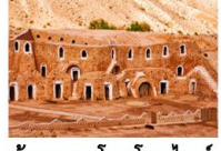
บ้านหลุมโทรโกลโดท์