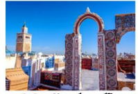
พิพิธภัณฑสถานบาร์โด