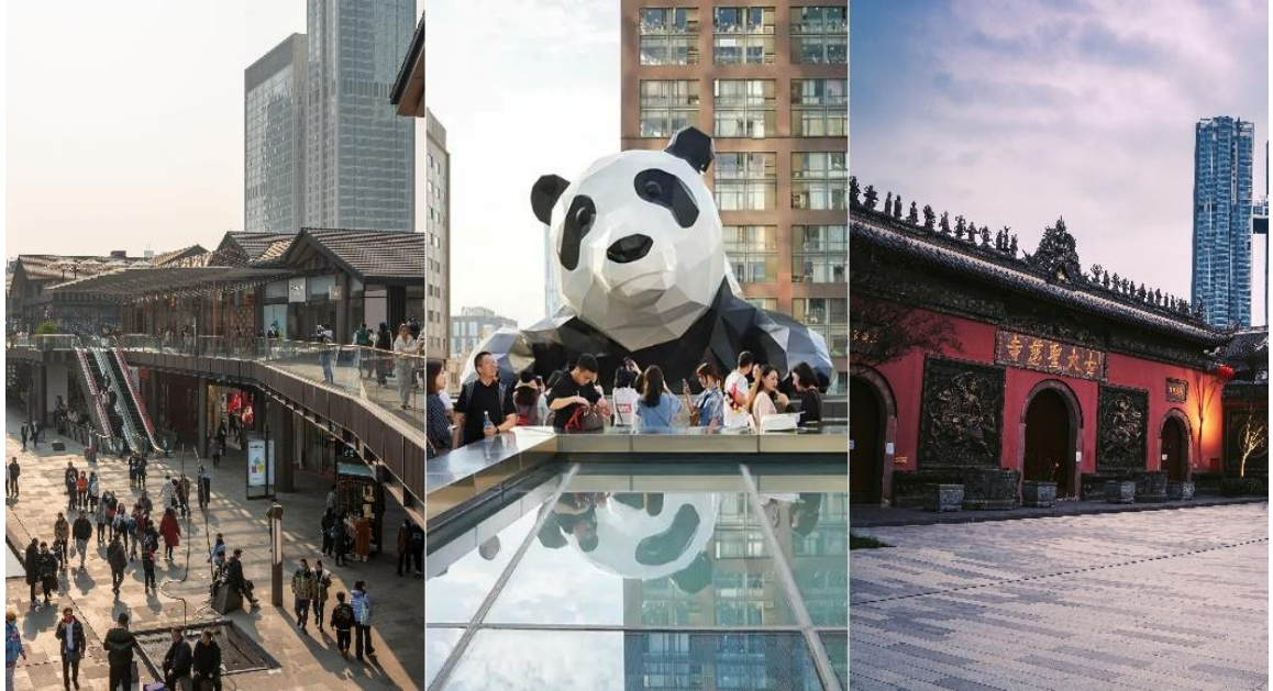
อีสระอาหารเย็น ตามอัธยาศัย

นำท่านชมจุดเช็คอินที่ หมีแพนด้ายักษ์ป็นตึก (IFS BUILDING) เป็นแพนด้าที่อ้วนน่ารักกำลัง ป่ายป็นตึน เป็นประติมากรรมแพนด้ายักษ์แขวนอยู่บนอาคาร IFS ในใจกลางเมืองเฉิงตู อีสระให้ ท่านเลือกซื้อสินค้าร้าน popmart ตามอัธยาศัย