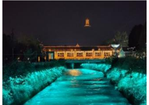
ที่พัก MINGZHI SHANGCHUN หรือเทียบเท่า 4 ดาวจีน

วันที่สาม ตูเจียงเยียน – จัตุรัสเทียนวู่ – รูปปั้นหมีแพนด้าเซลฟี่ – ห้องสมุดจงซูเก้อ – เมืองโบราณกวางเซียน – เจิงตู – พักอู่ไบ้