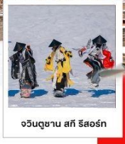
จิวินตุชาน สกี รีสอร์ท

9 ท่านออกเดินทาง เริ่มต้นเพียง 27,999 FREE VISA