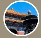
มูเตลูสุดปัง วัดลามะ