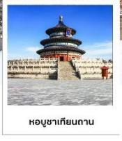
หอบูชาเทียนถาน