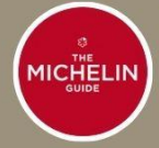
ห้ามพลาด ความอร่อย ระดับมิชลิน TAO TAO JU