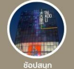
ช้อปปิ้ง ซานหลี่ตุ่น