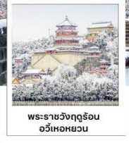
พระราชวังฤดูร้อน อวี๋เหอหยวน