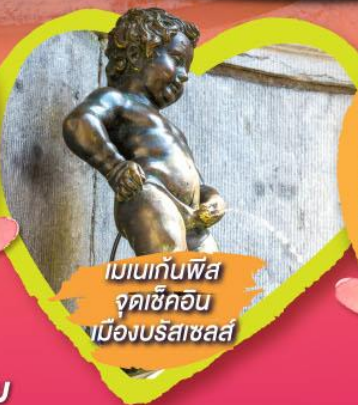
เมเนกันฟิส จุดเซ็คอิน เมืองบรัสเซลส์