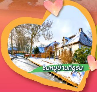
ชมหมู่บ้านทึร์น