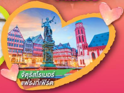
จัตุรัสโรเมอร์ แฟรงก์เฟิร์ต