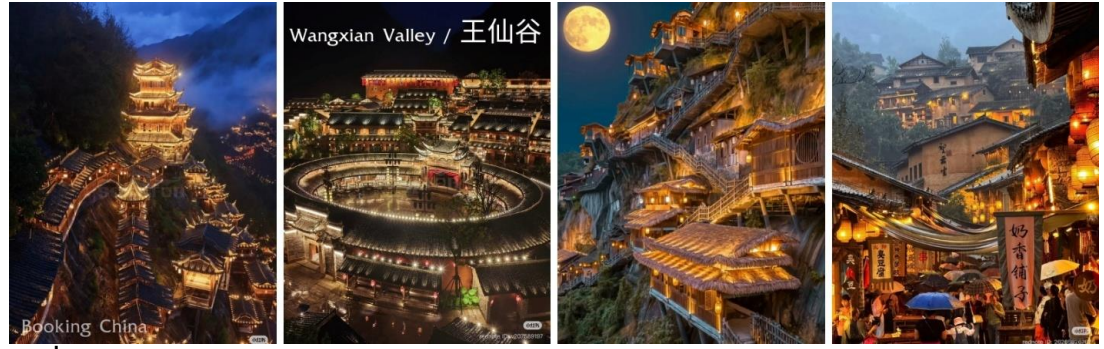
พักที่ JIANGNAN HAOTING HOTEL หรือเทียบเท่าระดับ 4 ดาวจีน

คำ บริการอาหารค่ำ ณ ภัตตาคาร นำท่านชม ทิวทัศน์ยามค่ำคืนค้ำดินหุบเขาวังเซียนกุ่ ซึ่งเรียกว่าเป็นจุดไฮไลท์หลักของเมืองแห่งนี้ เมื่อถึง เวลาค่ำคืนทั้งเมืองจะเปิดไฟทั่วทั้งเมือง แสงไฟวิบวับ บรรยากาศคดุดั่งเมืองสวรรค์ในแดนดิน