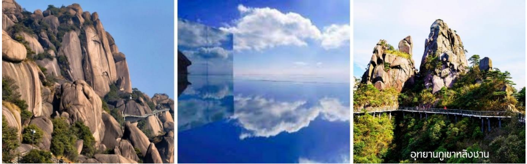
อุทยานภูเขาหลงซาน

จากนั้นเดินทางสู่ เมืองซาเหฺร่า ในมณฑลเจียงซี ใช้เวลาเดินทาง 2 ชม.โดยรถบัสปรับอากาศ จากนั้นอุทยานภูเขาหลงซาน (Lingshan Mountain หรือ เขาหลงซานน้อย) (รวมกระเช้า) ตั้งอยู่ในเมืองซ่างเหรา มณฑลเจียงซี ประเทศจีน เป็นภูเขาศักดิ์สิทธิ์ที่มีทิวทัศน์ธรรมชาติงดงามโดดเด่นด้วยทางเดินริมหน้าผาที่ยาวที่สุดในโลกและจุดชมวิวกระจกตาข่ายที่น่าตื่นตาตื่นใจ ตลอดเส้นทางเดินป่า คุณจะชมหินขนาดใหญ่ที่มีรูปร่างแปลกประหลาดมากมาย ซึ่งเกิดจากการกัดเซาะตามธรรมชาติมาเป็นเวลานาน จากนั้นนำท่านชม กระจกท้องฟ้า (Sky Mirror) เป็นจุดถ่ายรูปที่เป็นไอคอนิกของที่นี่ โดยพื้นกระจกจะสะท้อนภาพท้องฟ้าและทิวทัศน์ภูเขา ทำให้เกิดภาพที่สวยงามเหมือนไร้ขอบเขต