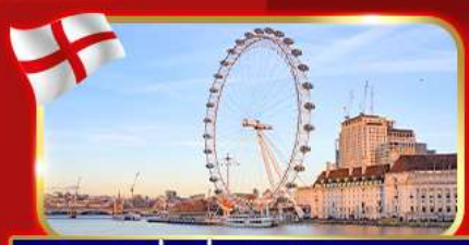
ชมวิวยิงช้างที่สูงที่สุดในยุโรป ลอนดอนอาย