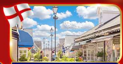
ช้อปปิ้งเอาท์เล็ต Bicester village