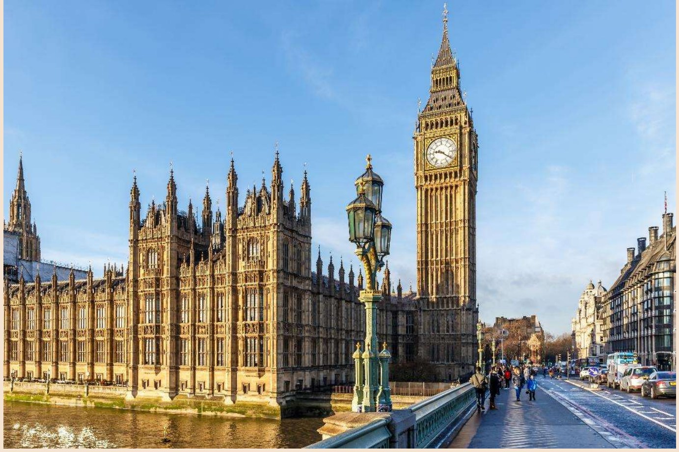
จากนั้นนำท่านถ่ายภาพบริเวณสะพาน Westminster Bridge จุดถ่ายภาพยอดนิยมที่สามารถชมวิว London Eye ได้อย่างชัดเจน พร้อมฉากหลังเป็นแม่น้ำเทมส์และสถาปัตยกรรมอันงดงามของกรุงลอนดอน ซึ่งถือเป็นหนึ่งในมุมมองถ่ายภาพที่สวยงามและเป็นแลนด์มาร์กสำคัญของเมือง