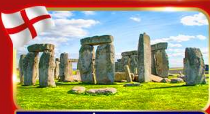
สโตนเฮนจ์ สิ่งมหัศจรรย์ของโลก