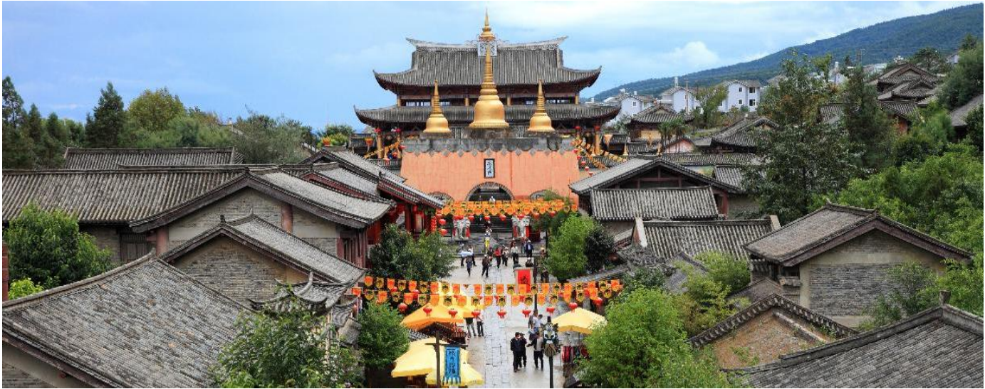
เมืองโบราณแห่งนี้มีประตูเมืองและกำแพงโบราณที่สร้างขึ้นตั้งแต่ยุคราชวงศ์หมิง (ค.ศ. 1368-1644) และยังคงมี

นำท่านสักการะ วัดเจ้าแม่กวนอิมแปลงกาย (Dali Guanyin Temple) ตามตำนานเล่าว่าเจ้าแม่กวนอิมได้แปลงกายโดยแบกก้อนหินใหญ่ไว้ข้างหลัง เพื่อขวางทางทหารมิให้รุกรานเข้าเมืองได้ ชาวเมืองจึงสร้างวัดแห่งนี้ขึ้นในราชวงศ์ถัง นับเป็นวัดที่มีประติมากรรมเยี่ยมยอดแห่งหนึ่ง จากนั้นนำท่านเดินทางสู่ เมืองโบราณต้าหลี่ (Dali Ancient City) เป็นหนึ่งในไฮไลต์ที่นักท่องเที่ยวไม่ควรพลาด