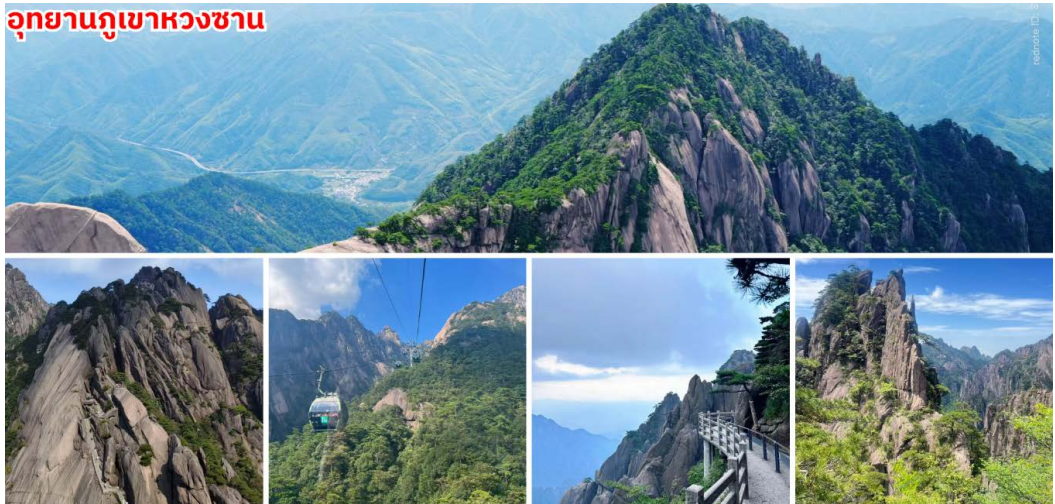
อุทยานภูเขาหวงซาน

จากนั้นนำท่านเดินทางสู่ ภูเขาหวงซาน (Huangshan หรือ Yellow Mountain) ตั้งอยู่ในเขตมณฑลอันฮุย ทางตะวันออกของจีน ความสูงประมาณ 1,864 เป็นภูเขาที่ได้รับการยกย่องว่าสวยงามที่สุดในประเทศจีนและเป็นมรดกโลก Unesco มีความโดดเด่นด้วยยอดเขาหินแกรนิตรูปทรงแปลกตาและสูงตระหง่าน ซึ่งเกิดจากกระบวนการกัดเซาะของธรรมชาติเป็นเวลาหลายปี ต้นสนโบราณที่เติบโตบนหน้าผาสูงชัน หนึ่งในสัญลักษณ์สำคัญของที่นี่ โดยเฉพาะ "สนรับแขก" ที่นักท่องเที่ยวนิยมมาถ่ายรูป ทะเลหมอก สีขาวลอยคลุมยอดเขา สวยราวภาพวาดจีนโบราณ โดยเฉพาะหลังฝนตกหรือช่วงเช้า จุดชมวิวอย่าง Bright Summit และ Beihai Scenic Area คือจุดยอดนิยมสำหรับเก็บภาพแสงทองเหนือทะเลหมอก กระเช้าชมวิวนาโรมานั่งกระเช้าขึ้น-ลงสู่ยอดเขา ชมวิวมุมสูงแบบ 360 องศา